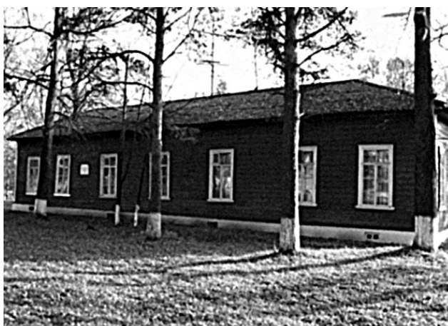
Дом офицерского собрания в Новой Ладогe помнит Суворова

На памятных маневрах 1765 года Суздальский полк поразил саму императрицу отличной от других, но наиболее эффективной выучкой. Официальные биографы Суворова именно от тех маневров вели начало славы полководца.