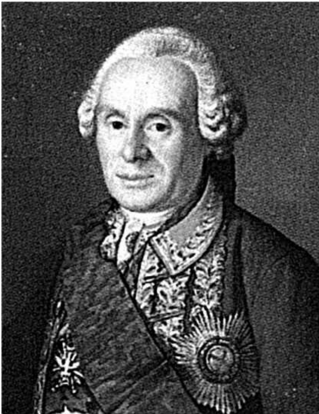
Портрет генерал-аншефа Виллима Виллимовича Фермора

Генерал Фермор вошёл в историю во многом благодаря своему великому ученику, но и без суворовского ореола мы видим честную армейскую судьбу боевого генерала.