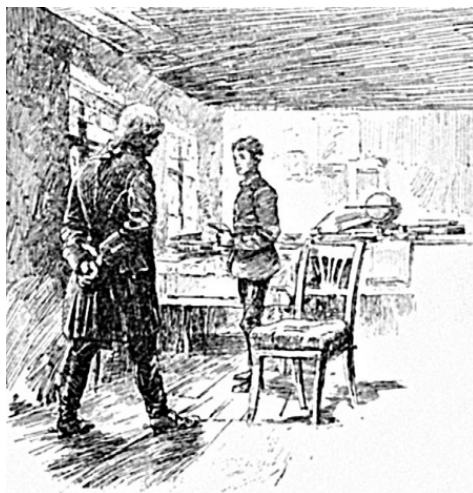
Юный А. В. Суворов. Художник Н. Самокиш