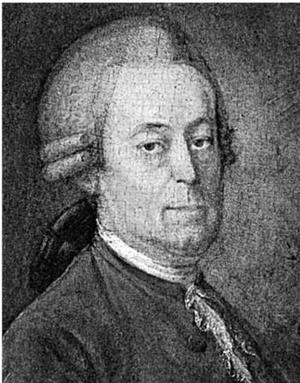
Портрет Василия Ивановича Суворова. Неизвестный художник

Во время Семилетней войны В. И. Суворов побывал генерал-губернатором завоёванной Пруссии, проявив себя дельным и экономичным политиком. Пётр III назначил его Tobольским губернатором, но по неизвестным причинам поездка в Сибирь сорвалась, а пост губернатора занял совсем другой человек. Василий Иванович активно участвовал в екатерининском дворцовом перевороте: именно он разоружил и арестовал голштинский генералитет в Ораниенбауме. Не удивительно, что при Екатерине он достиг завидных высот военной карьеры, стал генерал-аншефом, премьер-майором Преображенского и подполковником Измайловского полка, всю жизнь служа по юридической части и при Провиантском департаменте и выполняя поручения, о которых до Суворова, уже также бывшего генерал-аншефом в дни составления автобиографической записки, «сведения не доходили». Репутации боевого генерала у Василия Суворова не было. Зато до нас дошли сведения о легендарной бережливости Василия Ивановича Суворова, позволившей ему приумножить семейные капиталы. Это качество унаследовал и