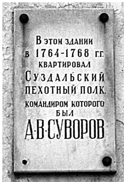
Мемориальная доска в Новой Ладого

сие почеловечнее». Думаю, в этом письме нашлось место своеобразной суворовской иронии – почти как в анекдоте про сталинского двойника (Сталину доложили, что в Москве появился его двойник, который носит такую же причёску и усы. – Расстрелять, – сказал генералиссимус. – А может быть, побрить? – Что ж, можно и побрить). Русский генерал считал, что казнями можно только настроить против себя местное население, что в условиях партизанской войны было чревато роковыми последствиями для суворовского корпуса.