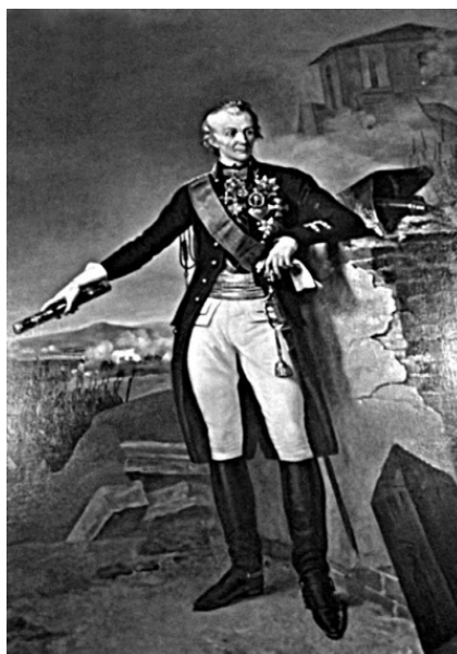
Портрет А. В. Суворова. Художник Н.-С. Фросте. 1838 г.

Первое время в корпусе Берга Суворов действовал в составе легкоконных команд, пользуясь относительной самостоятельностью. Так, сформировав отряд из казаков Донского полка С. Т. Туроверова, Суворов захватывает город Ландсберг. Нападение на прусский отряд вышло оглушительно внезапным, удалось взять в плен двоих офицеров и тридцать солдат. По приказу Суворова солдаты разобрали мост через Варту, чтобы помешать продвижению армии Фридриха. Во всех схватках с прусскими отрядами Суворов выходит победителем, действуя смело и решительно. Рассеяв и потеснив противника, Суворов непременно устраивает преследование, стремится уничтожить врага, ибо «недорубленный лес снова вырастает». Мы снова и снова будем повторять эту максиму Суворова, которой он руководствовался во всех боях.