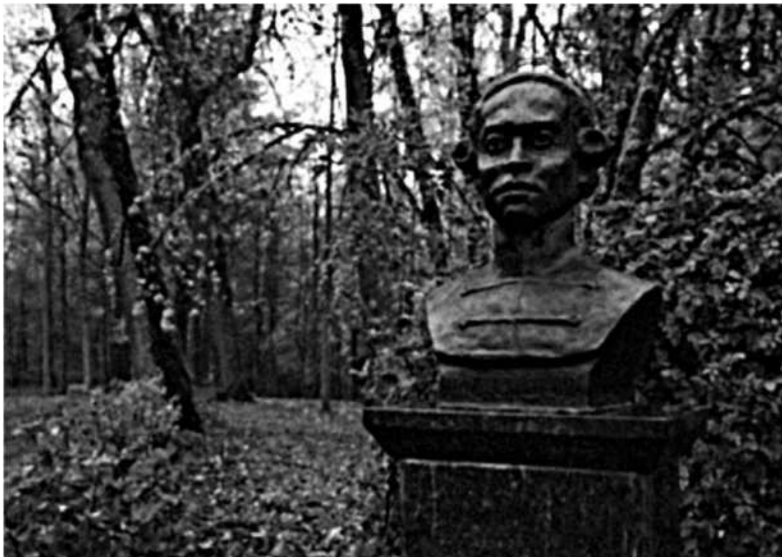
Памятник Абраму Петровичу Ганнибалу в Пушкинских Горах

Формально Суворов не был кадетом, но на мраморной доске в Первом кадетском корпусе имя слушателя занятий, генералиссимуса А. В. Суворова значилось наряду с выдающимися выпускниками корпуса – фельдмаршалами П. А. Румянцевым-Задунайским, М.Ф. Каменским, А. А. Прозоровским.