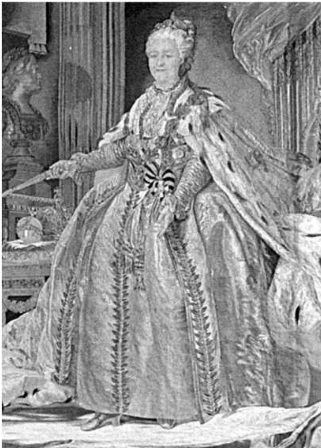
Императрица Екатерина Великая, шпалера

Александр Васильевич, рачительно относившийся к солдату, не терпевший житейских излишеств, вникавший в экономику, в хозяйственную жизнь своих поместий. Суворовы довольствовались малым, совершая великое.