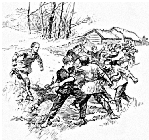
Детство А. В. Суворова. Художник Н. Самокиш