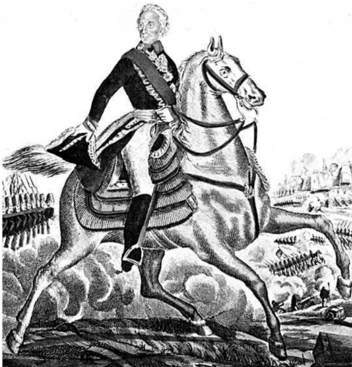
Лубочный образ Александра Васильевича Суворова