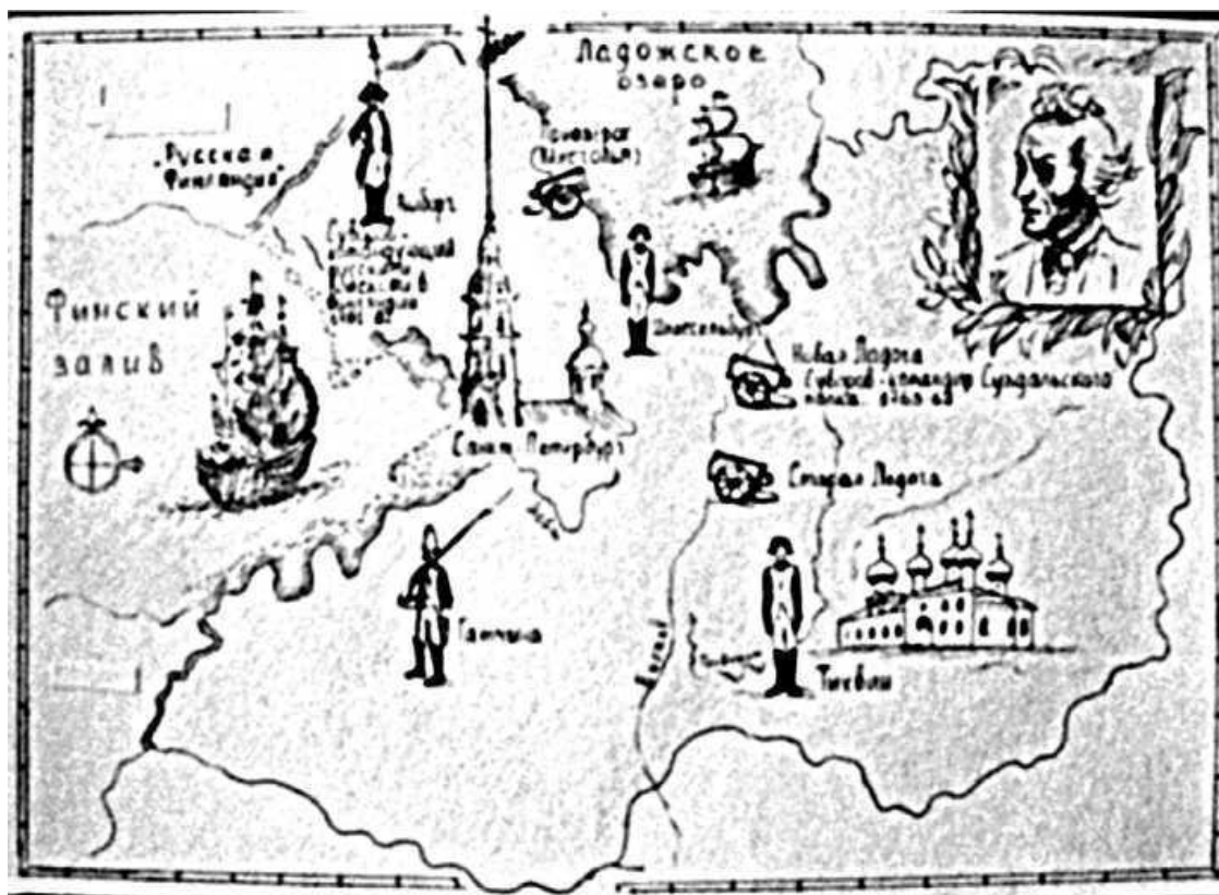
Суворов в Приладожье.

изменении политической конъюнктуры петербургская дипломатия готова была перестроиться и проглотить Польшу. Империи во все времена за милую душу съедают то, что могут переварить.