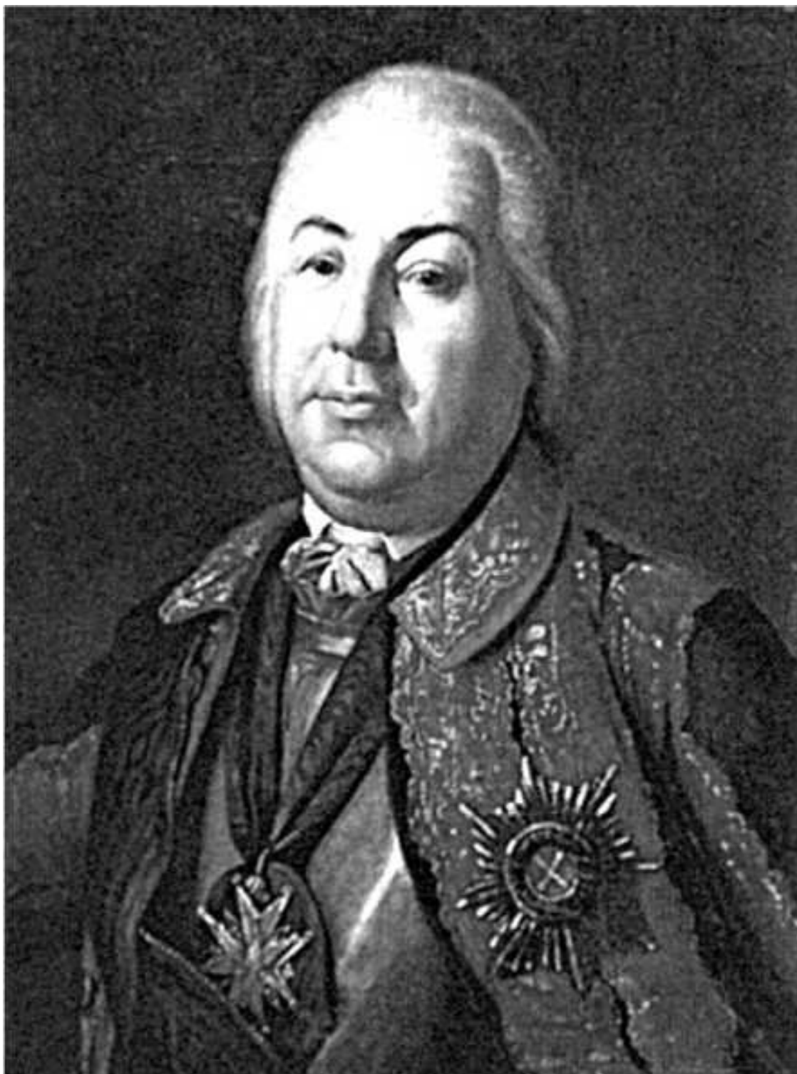
Портрет генерал-фельдмаршала Петра Семёновича Салтыкова

Заслуги великого солдата в Семилетней войне были вознаграждены с болезненным для Суворова опозданием. В сражениях Семилетней войны на Румянцева подполковник Суворов произвёл впечатление как способный, энергичный командир кавалерийских отрядов. Реляцию великий Румянцев писал Петру Третьему 6 июня 1762 года: «Генерал-майора князя Голицына пехотного полку подполковнику Александру Суворову, как он всех состоящих в корпусе моём подполковников старее, да и достоин к повышению в полковники, но что он, хотя в пехотном полку счисляется, однако почти во все минувшие кампании, по повелению командующих