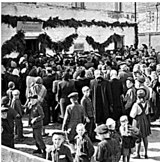
Открытие Суворовского музея в Новой Ладоге 18 мая 1950 года

чит несколько суворовских уроков, а после окажется за океаном, в армии генерала Джорджа Вашингтона. Один из любопытных и достойных нашего уважения современников Суворова – Казимир Пулавский, полководец предприимчивый и энергичный.