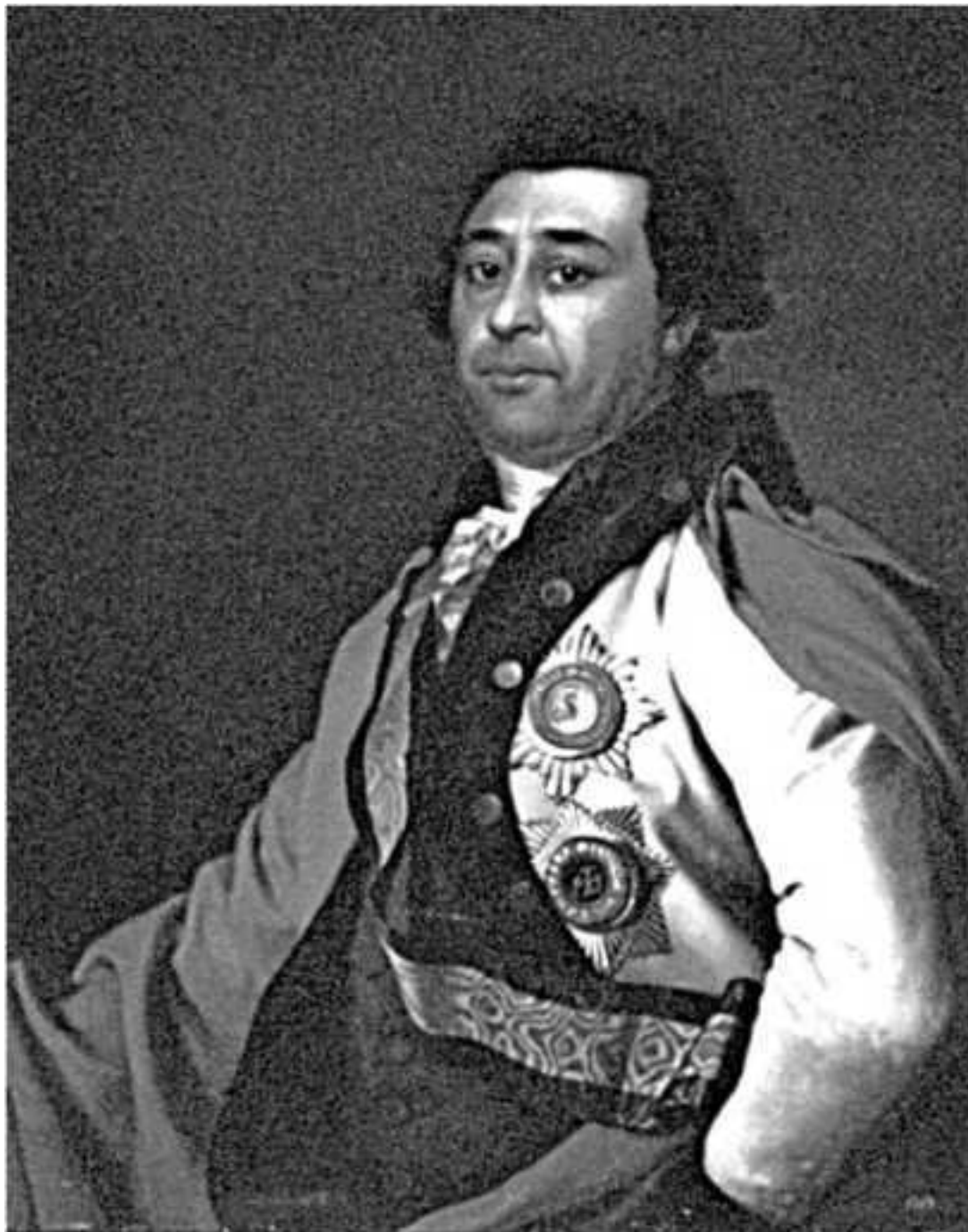
Портрет Ивана Абрамовича Ганнибала. Художник Д. Левицкий

Караульная служба в Летнем саду, в Адмиралтейской крепости и в Петергофе была основной обязанностью семёновцев. Они не только охраняли царский покой от возможных нападений, но и следили за «пожарным случаем», наблюдая на чердаках за печными трубами. Несомненно, он ощущал себя в самом центре родной империи, проникался почётным долгом царёвой охраны. Для людей одержимых, зажжённых героической идеей, гвардейская служба была лучшей школой патриотизма. Распространённой практикой среди офицеров-дворян было отлынивание от караульной службы: они нанимали солдат, которые и отстаивали дежурство за высокородных офицеров. Суворов же относился к дежурствам ревностно, знал наизусть статьи устава, посвящённые обязанностям часового, и, напротив, нередко выручал товарищей, подме-