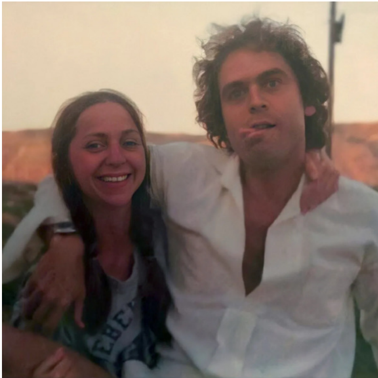
Лиз Клэпфер и Тед Банди, июль 1975 г.

Если Банди и думал, что на этом всё закончится, то он очень глубоко ошибался. Нет. Конечно, первое время полиция Сиэтла и округа Кинг безуспешно разыскивали его, но 1 декабря 1975 года прокурору Сиэтла Филу Киллиену (Phil Killien) сообщили, что Банди в данную минуту находится