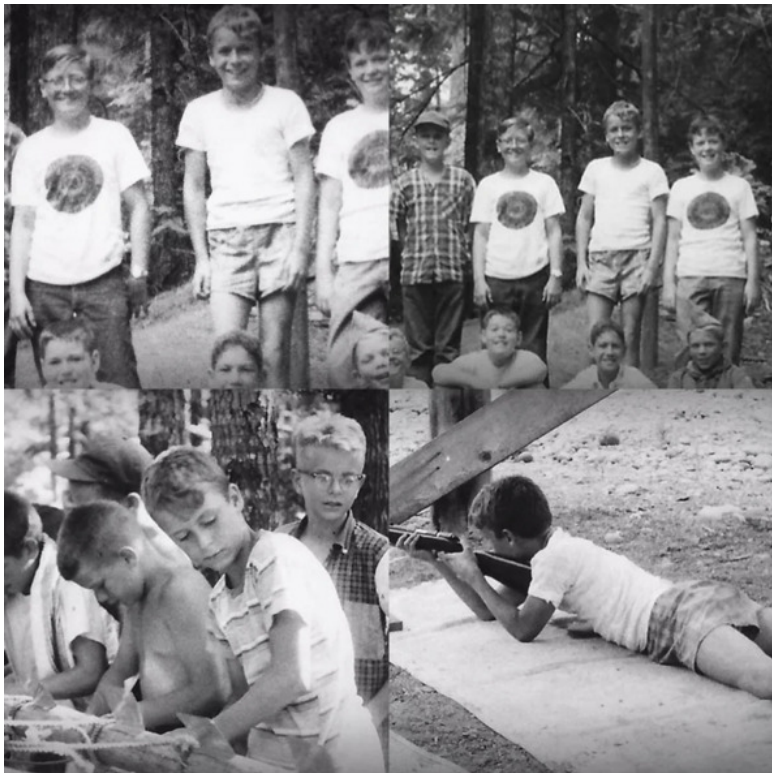
Тед Банди в лагере бойскаутов.

На самом деле, я бы не стал так сильно заострять внимание на возможном дефекте речи у юного Теда, и считать это причиной последующих нападений и убийств. В мире полно детей с дефектами речи, но не все они стали серийными убийцами. Возможно, что просто этот дефект стал одним из