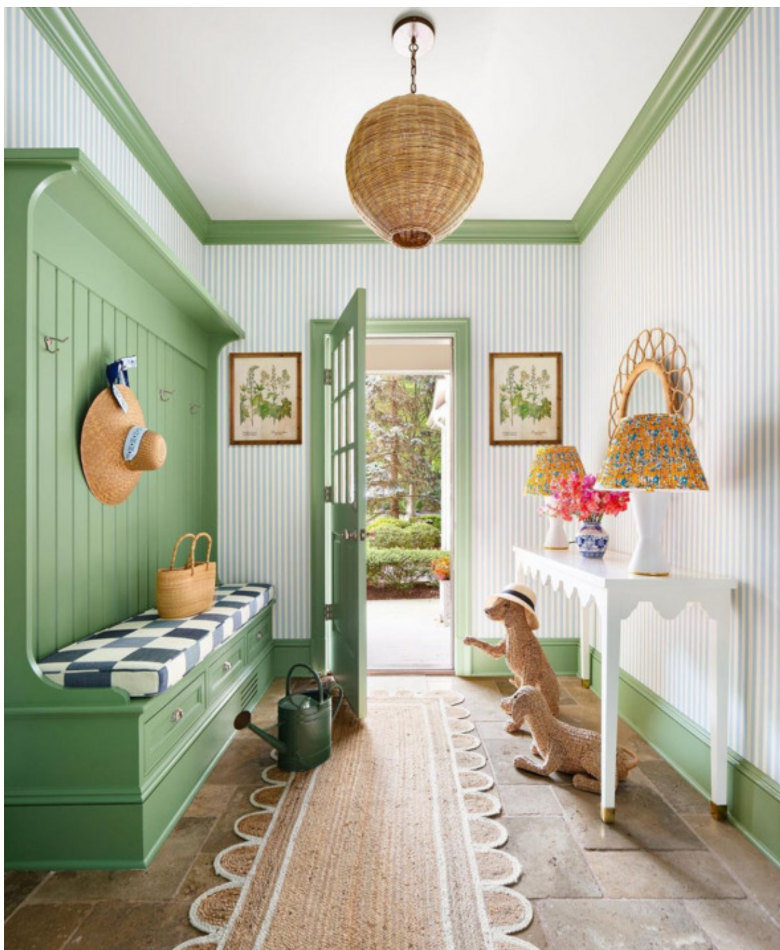
ИДЕЯ №1. Ультра-светлая мята

Прихожая задаёт тон всему дому. Именно здесь человек впервые переступает порог вашего пространства, и цвет стен мгновенно формирует первое, самое сильное впечатление. Не бойтесь смелых решений — именно в небольших переходных зонах эксперименты с цветом дают самый яркий и запоминающийся результат. Здесь можно позволить себе то, что в больших комнатах выглядело бы слишком интенсивно. Главное — выбрать оттенок, который будет работать при разном освещении, от утреннего естественного света до вечернего искусственного, и при этом сохранять практичность и комфорт.