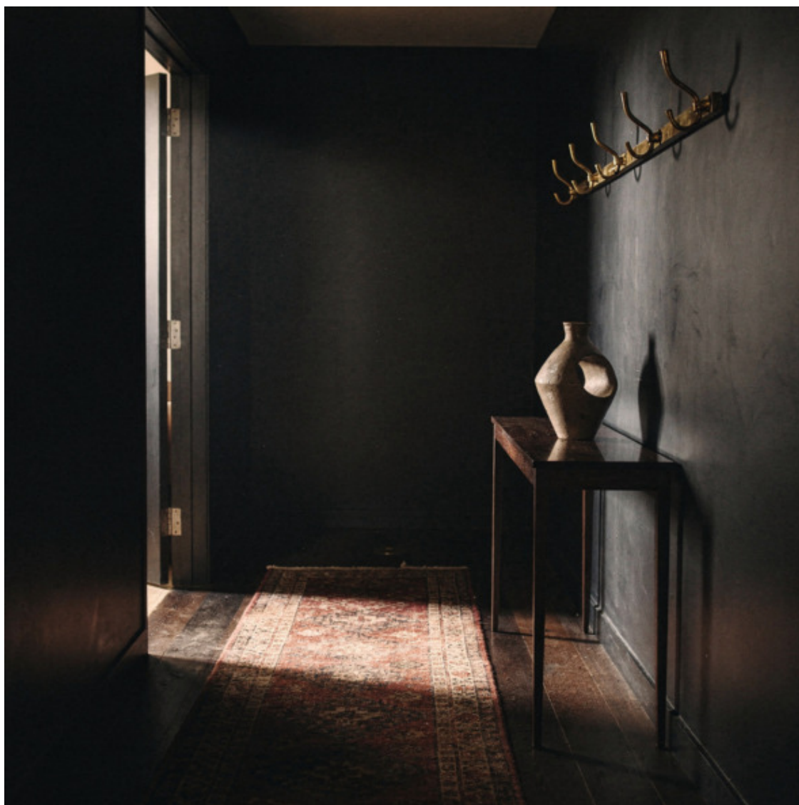
ИДЕЯ №2. Чёрная матовая краска

Для профессиональных архитекторов и дизайнеров интерьеров: этот оттенок — идеальный инструмент для работы с небольшими пространствами. Он отлично отражает свет, усиливая ощущение воздуха и порядка. Рекомендуем тестировать краску при разном освещении вашей прихожей — цвет «оживает» по-разному в зависимости от окон и ламп.