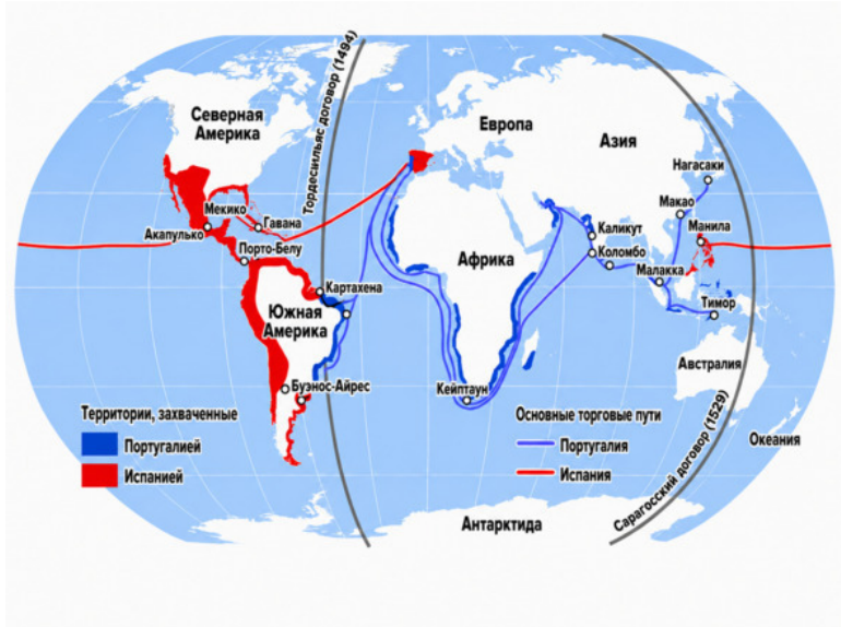
Рис 1. Раздел колониального мира между Португалией и Испанией, двумя морскими католическими державами по Тордесильясскому (1494) и Сарагосскому (1529) договорам.