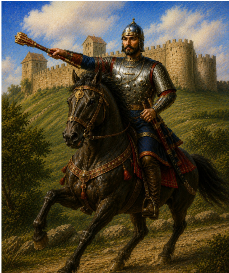
12. «Воистый» воевода Ивана Грозного, князь Дмитрий Хворостинин. В битве при Молодях (1572 год), вместе с князем Воротынским разгромил крымских татар. Участник Ли-