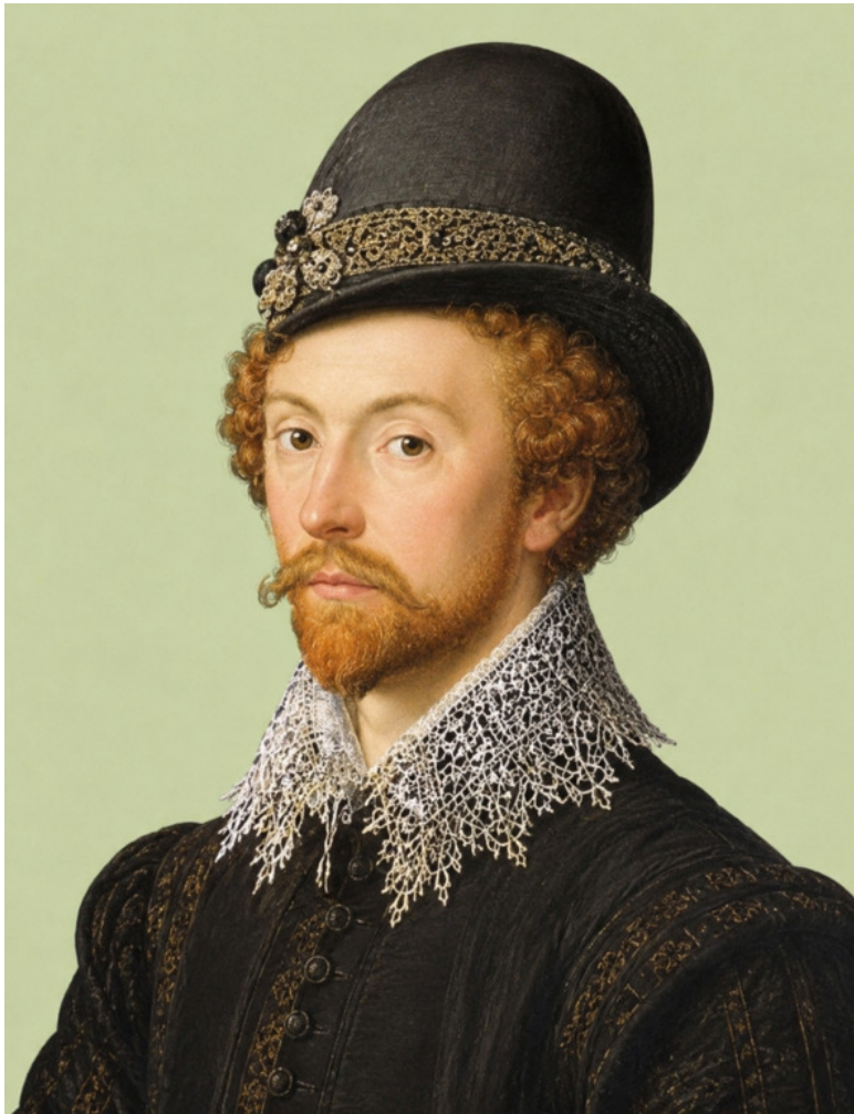
14. Энтони Джексон, английский посол в России, замор-