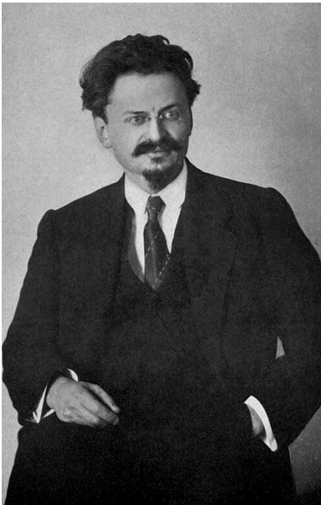
Председатель Петроградского совета Лев Троцкий в 1917 году.