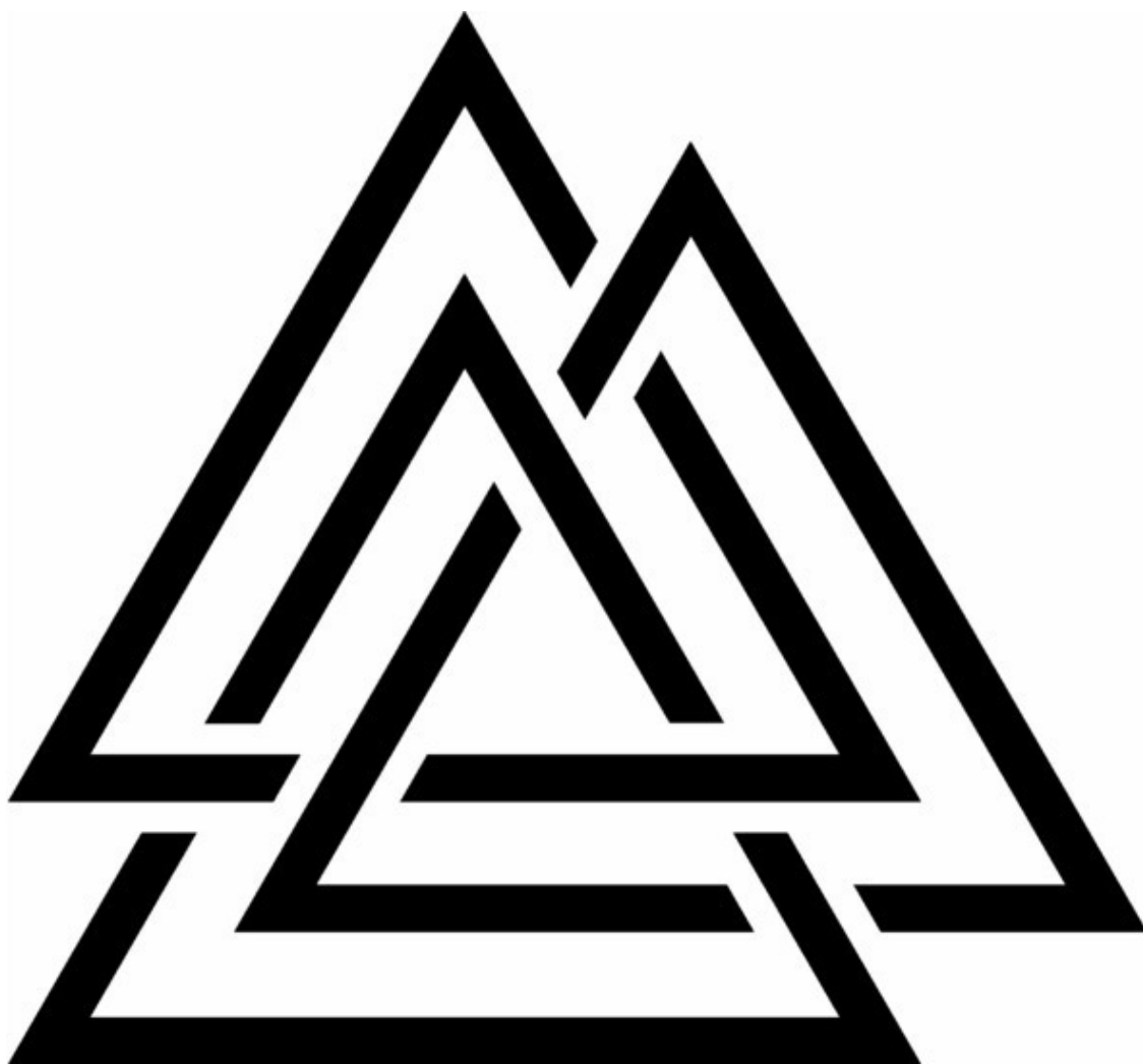
Рис. 1. Валькнут

При этом, эта энергия совокупная, то есть состоящая: из энергии Космоса, из энергии Земли, и энергии человека, в своем переплетении этих энергий формирующая энергетическую структуру наподобие Валькнута: