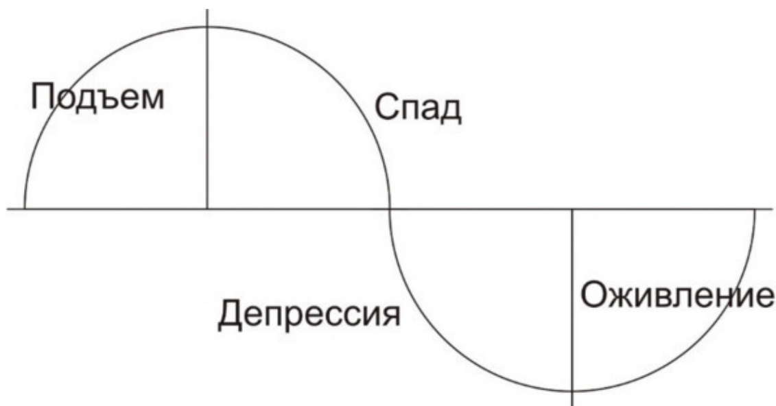
Рис 1. Цикл Кондратьева

При этом сам цикл (и это, безусловно, эволюционный цикл) соответствует движению (развитию) по Руническому Кругу, и мы можем разбить цикл не только на общепринятые фазы цикла — подъем, спад, депрессия, оживление, но и на рунические этапы. Это вы можете увидеть на рисунках ниже.