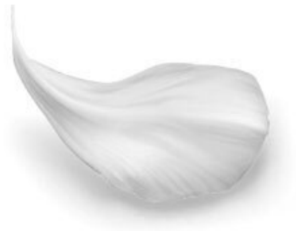
Иллюстрация на обложке Мятное варенье

© Оформление. ООО «Издательство „Эксмо“», 2026