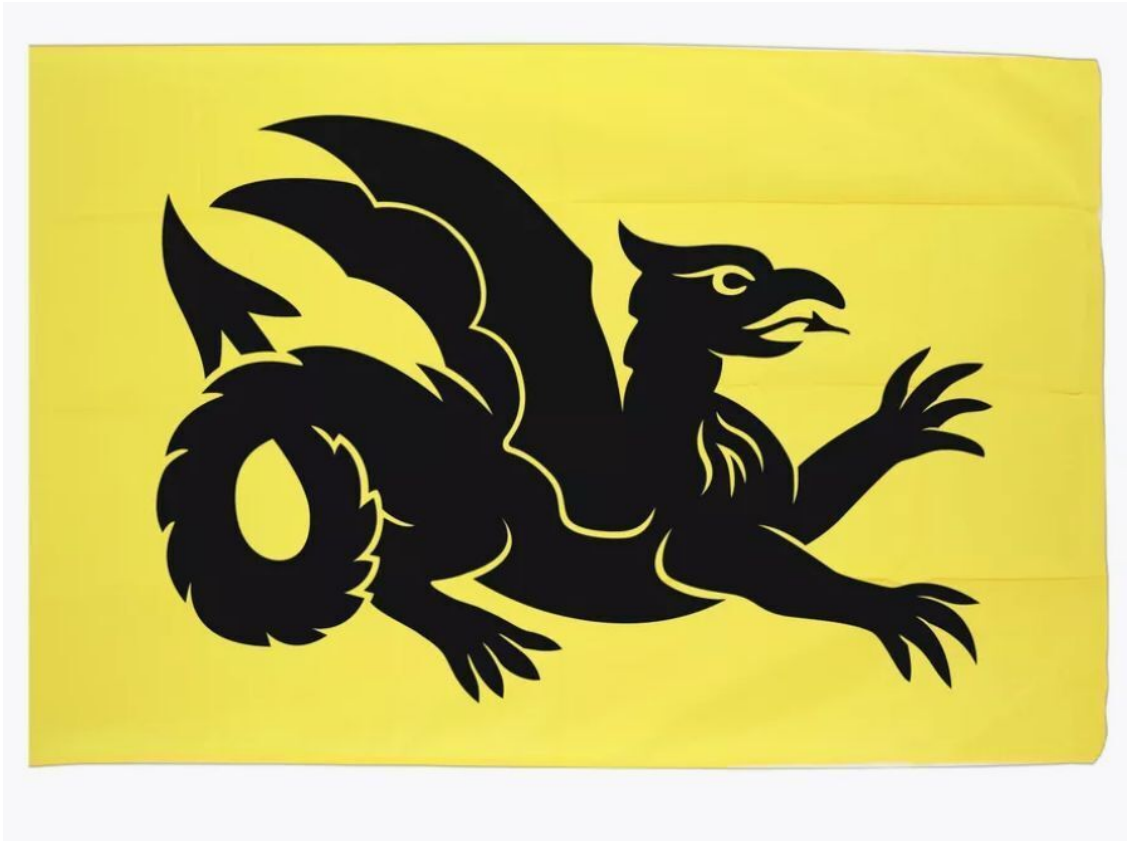
Флаг Великой Тартарии