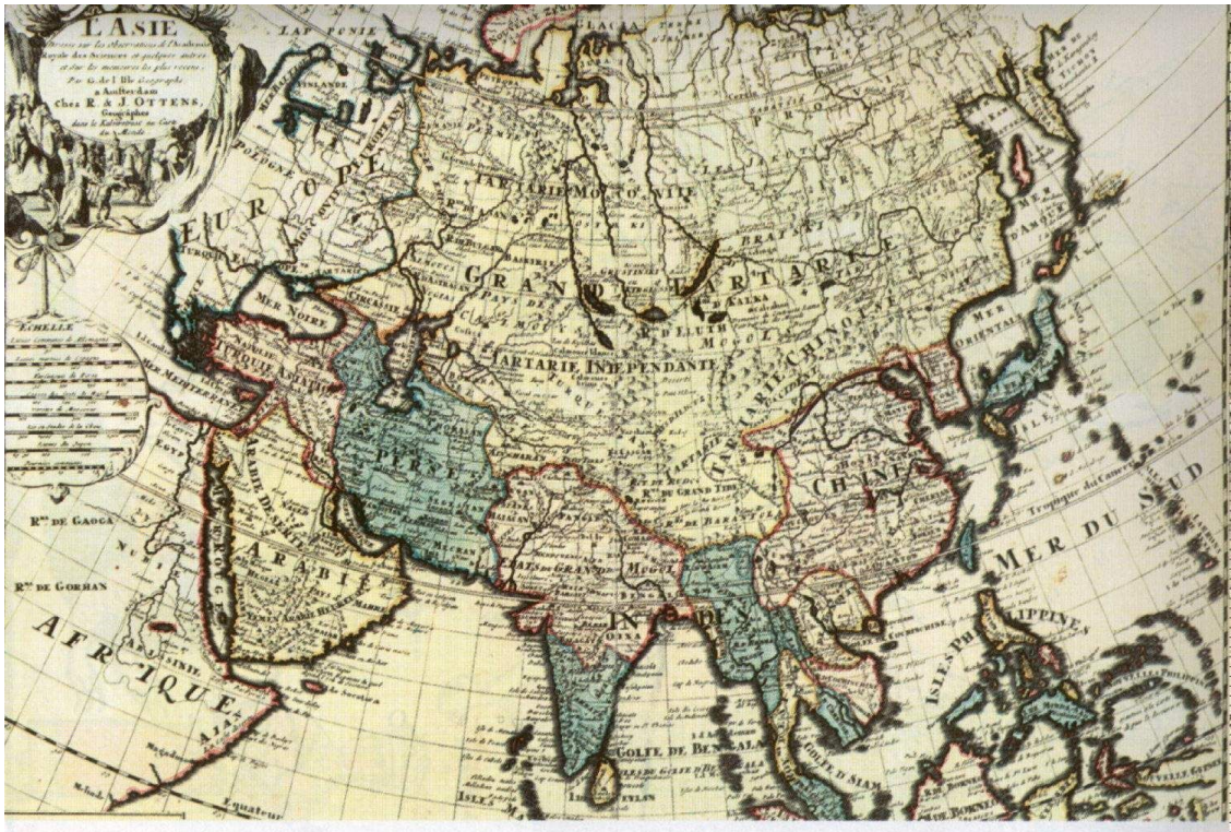
Карта Великой Тартарии