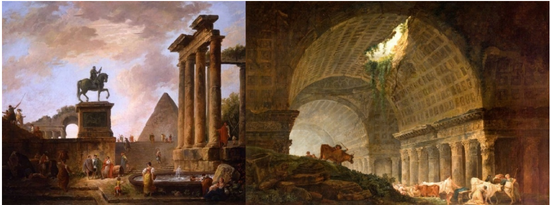
Картины художника-руиниста Роберта Юбера ок. 1760 г.