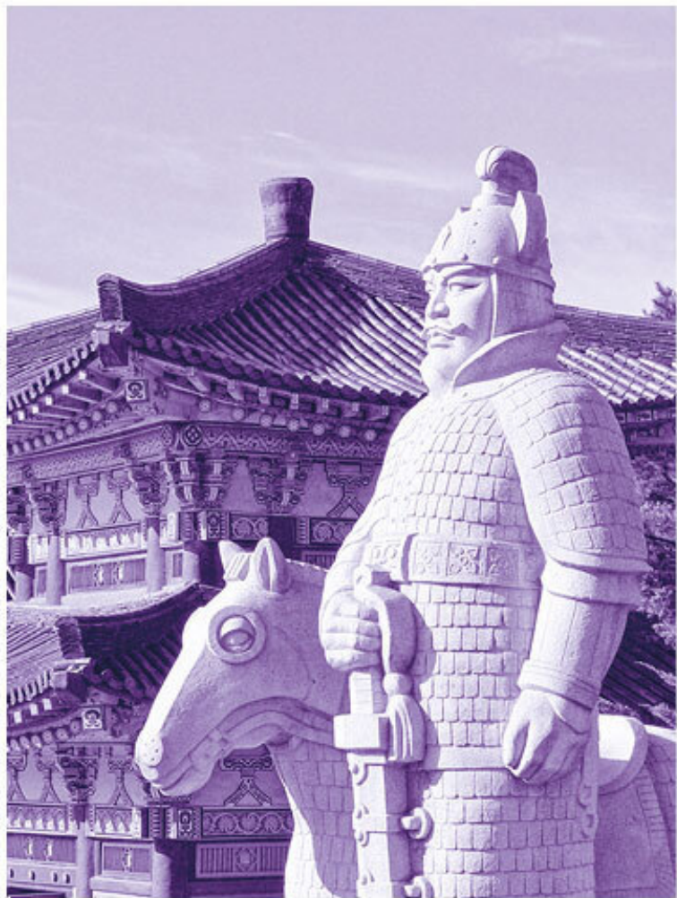
Каменный страж и его конь перед гробницей короля Чу-