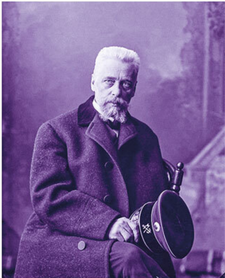
Николай Георгиевич Гарин-Михайловский.