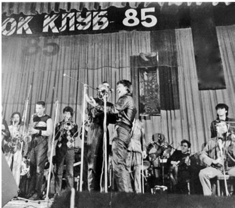
Концерт в Ленинградском рок-клубе. 1985

Знающему первопричину всех вещей незачем отыскивать логику зримых связей, отделять конец от начала или подыскивать приличные случаю имена. Он может стать Иваном Бодхидхармой, Иванушкой-дурачком и первым апостолом «дзен» (буквально – посвященным в дхарму); мастером Бо или просто Ивановым, читающим на трамвайной останов-