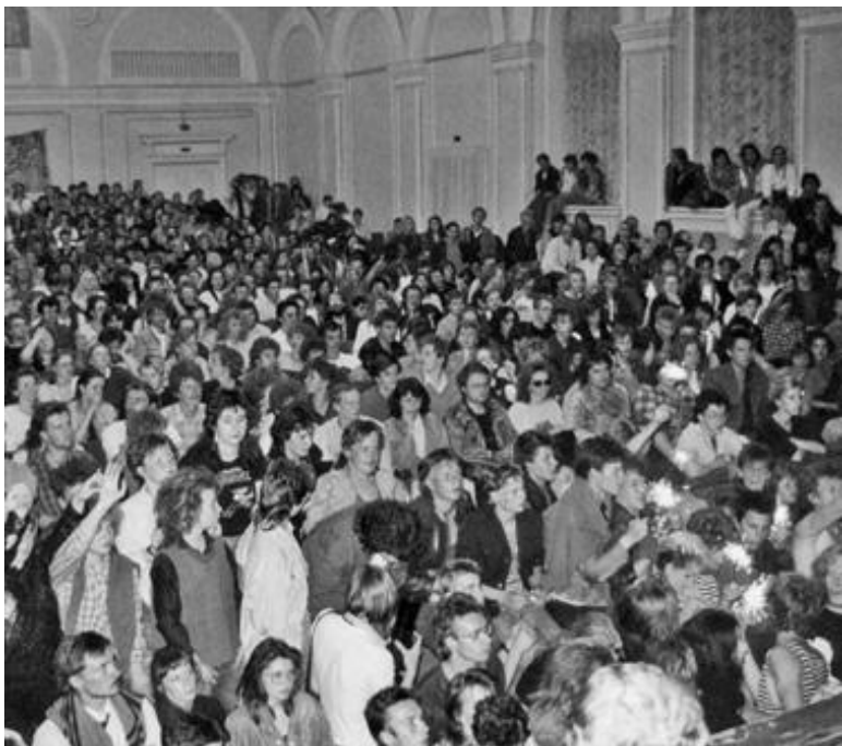
Концерт в Ленинградском рок-клубе. Из архива Джоанны Стингрей 1985

«Тридцать спиц соединяют в одной ступице, но употребление колеса зависит от пустоты между ними. Из глины делают сосуды, но употребление сосудов зависит от пустоты в них», – сказано в даосском трактате «Дао дэ цзин». Поэтическая манера Гребенщикова состоит в попытке высвобождения содержательных пустот между словами (так Сер-