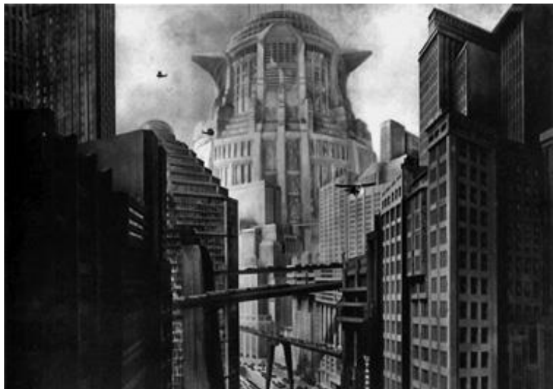
Метрополис . Реж. Фриц Ланг. 1926

ним следовала архитектура, и функции между ними распределялись по чисто религиозной шкале. В то время как «сталинская готика» (вдохновленная не столько католицизмом, сколько Метрополисом Фрица Ланга) должна была смирять «пред лицом городским Господним», внушать чувство подавленности и малости, порождать в подсознании «комплекс винтика» и мистический трепет причастности к Механизму, кинематографу надлежало вырвать гражданина из лап реальности, окунуть его в миф как в быт, и по светлomu пути – прямо в светлое будущее, на экране ставшее настоящим.