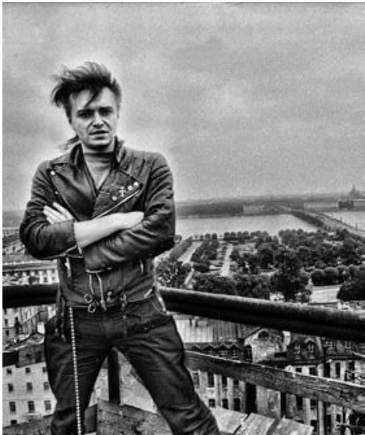
Константин Кинчев на минарете ленинградской мечети. 1987

Рок-герой отвергал не конкретные черты политического