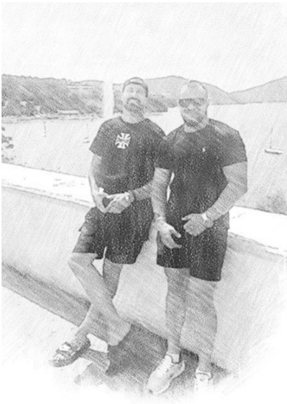
«Вольф» и «Муха»

После кафе они расстались, она осталась в Ялте у своей гостиницы, а он на своём тёмно – синем «BMW X7» рванул домой, в Симферополь и посвятил эти две недели сборам в командировку.