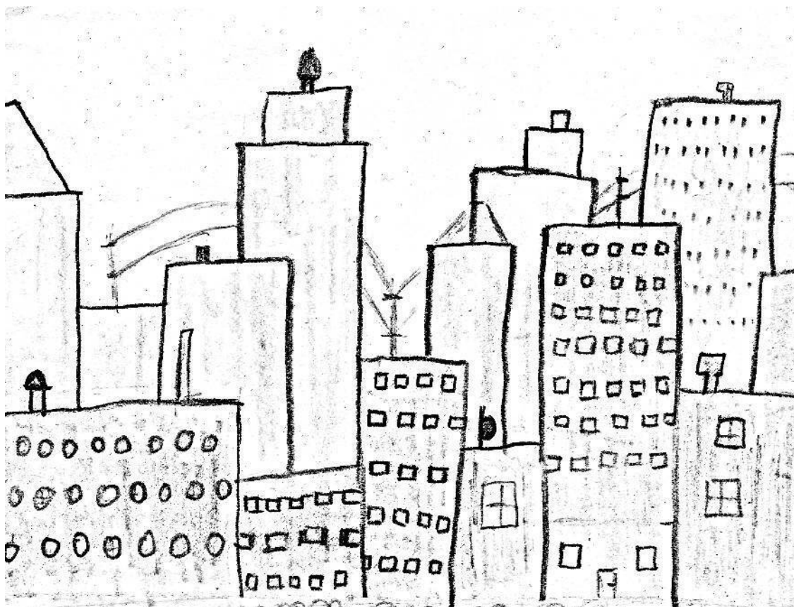
Рисунок части города Златоград (Вид из кабинета редактора Льва)

Этот пейзаж напоминает гигантский муравейник, где вместо муравьёв — люди.