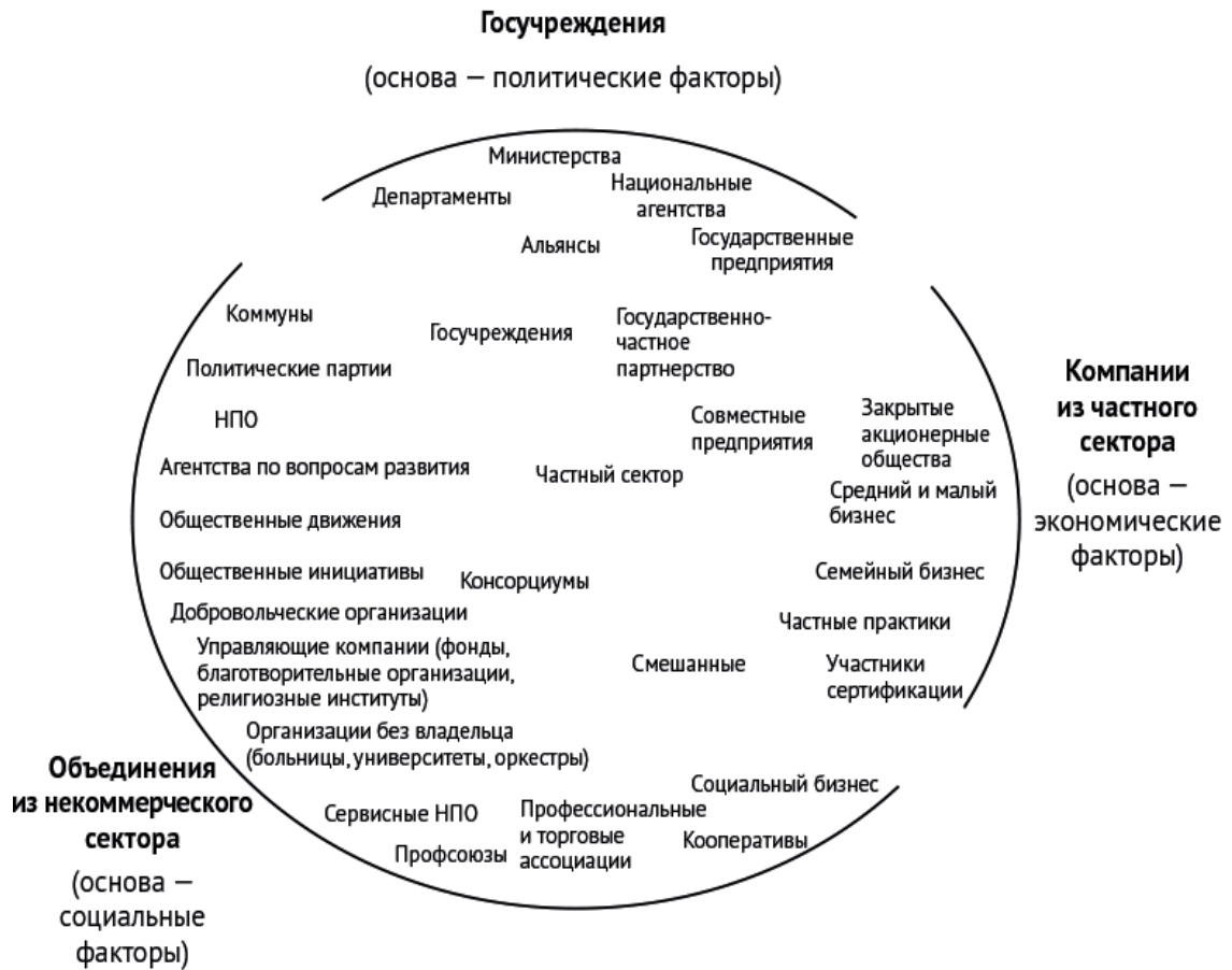
Рис. 1.1. Карта мира организаций

творительные фонды, НПО, частные университеты) 1 . Многие из перечисленных вам, наверное, знакомы, но вот они все вместе: