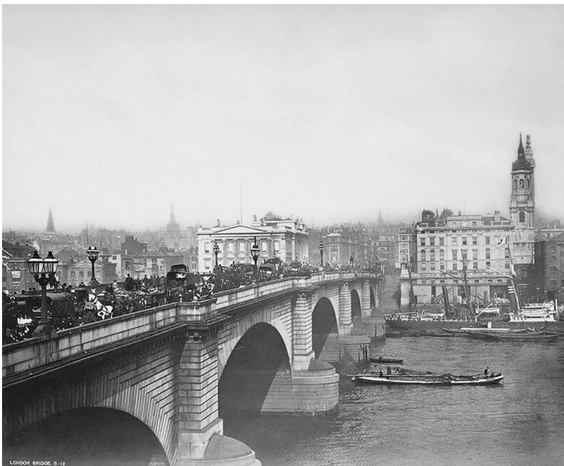
Лондонский мост между 1870 и 1890 годами

А Лондон в конце XIX века неудержимо менялся под влиянием промышленной революции. Демонический, загадочный и потусторонне-опасный город Чарльза Диккенса и Оскара Уайльда избавлялся от тьмы, помойных запахов, мусорных свалок, обрстал транспортной инфраструктурой, бурно застраивался – он вступал в период Столицы Империи, превращаясь в того самого прародителя стимпанка, которого так любит искусственный интеллект.