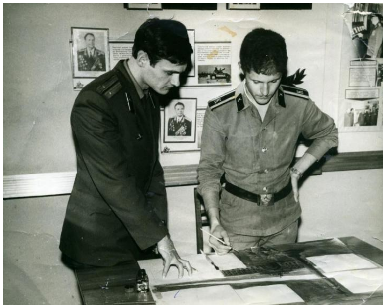
1979 год. Тбилиси. ТВАККУ. Слева автор.