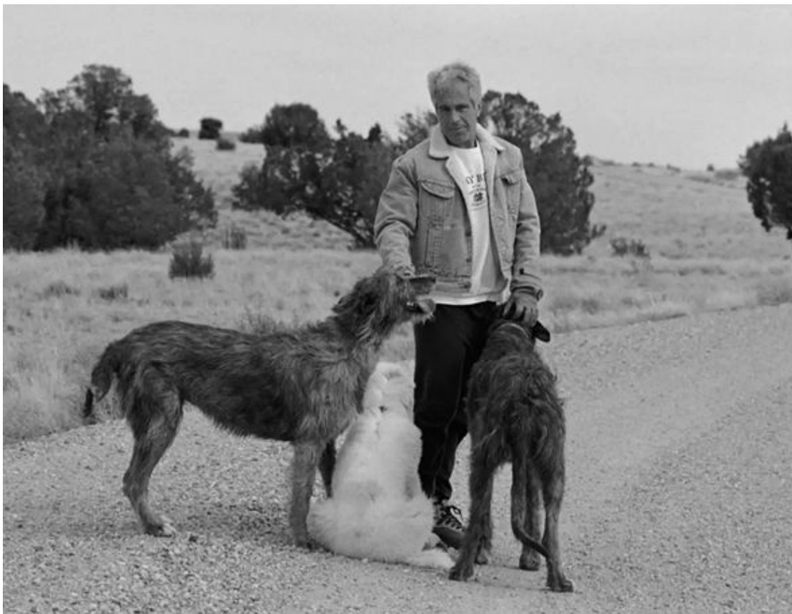
Эпштейн на территории своего ранчо в Нью-Мексико

Сегодня мы не можем поставить точку в его истории. Только многоточие. Следующие пять, десять или даже 50 лет нас ждут новые обнародования секретов богатых и властных. Вот увидите: JE 1 там будет.