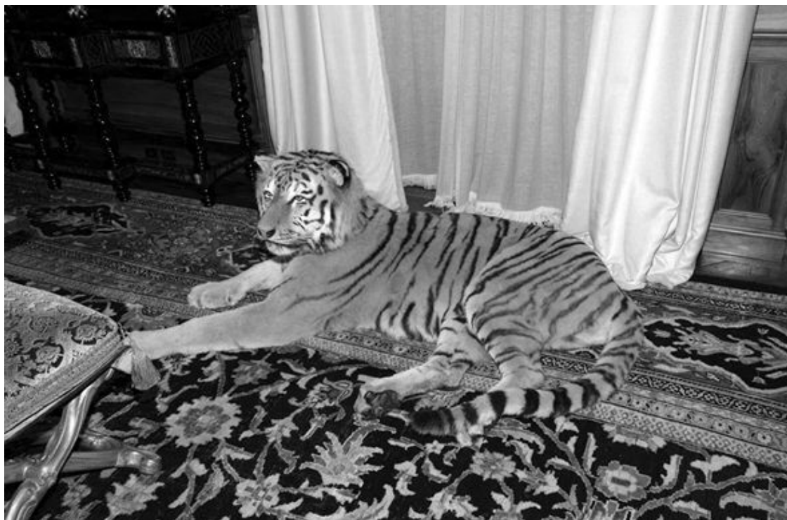
Чучело тигра – часть декора особняка Джеффри Эпштейна в Нью-Йорке

«Я бы никогда не догадался, что человек, с которым я работал более десяти лет назад, мог причинить боль стольким людям. Я копался в своей душе, размышлял и сожалею, что мой путь когда-либо пересекался с его».