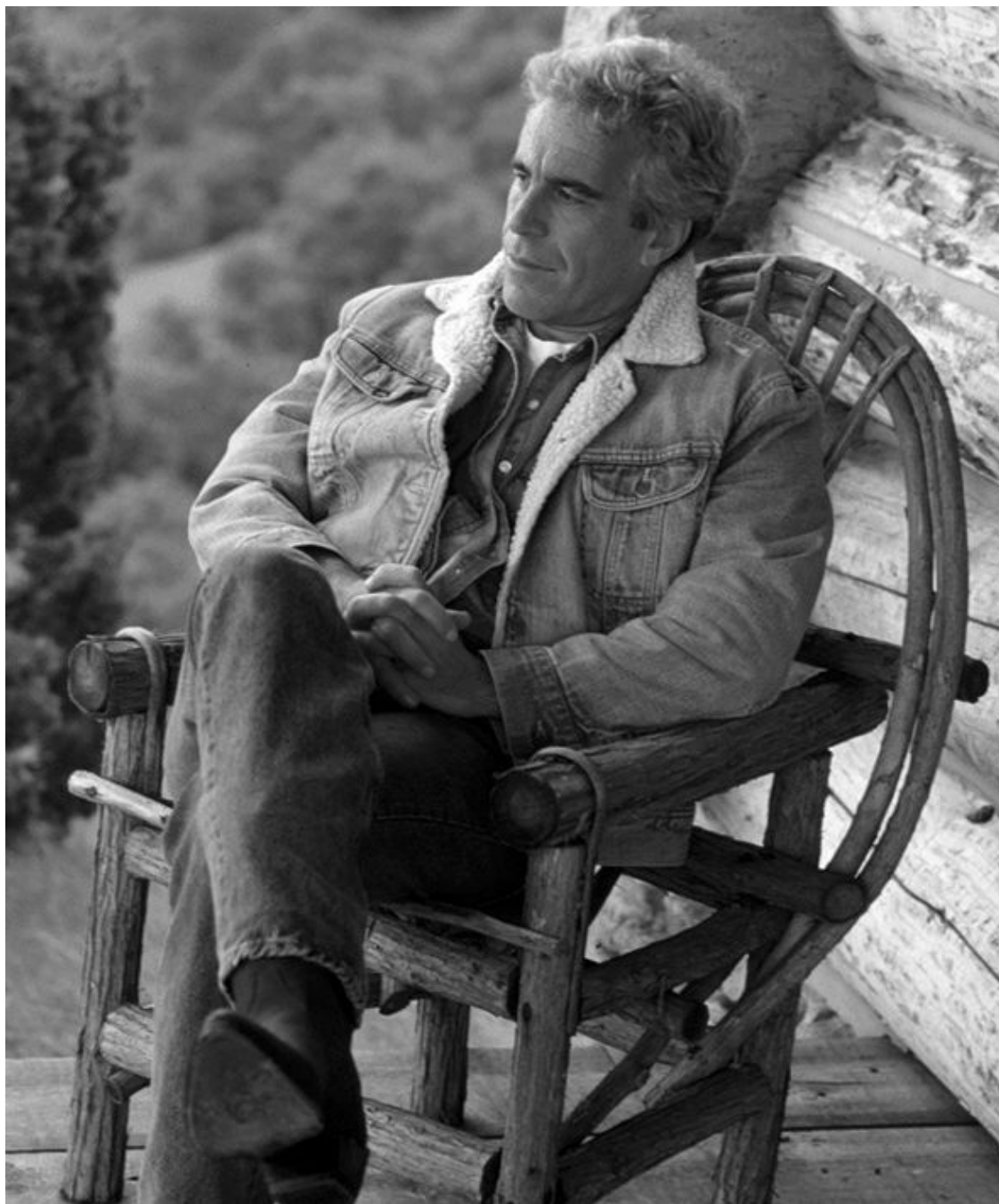
Эпштейн на своем ранчо в Нью-Мексико

Эпштейн – человек прецедент. Раньше мы могли только догадываться, что сильные мира сего далеко не безгрешны. Теперь же знаем это наверняка.