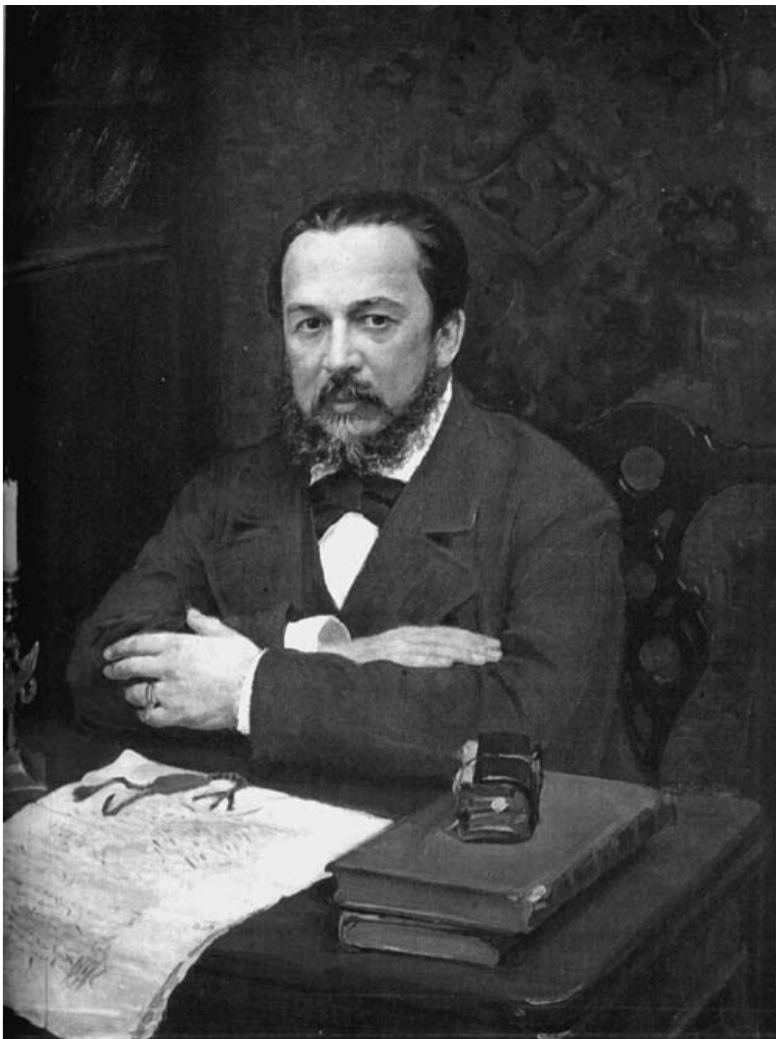
А.С. Уваров. С портрета И.С. Куликова

О самом человеке неолитического периода мы тоже уже кое-что знаем. Кроме раскопок, сделанных вообще по России, есть несколько специально волынских, сделанных в 1870-х и 1880-х годах местными исследователями. На основании этих последних можно прийти к следующим выводам. На всем пространстве Волыни довольно густо 28 , особенно по берегам