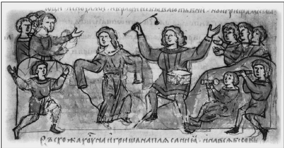
Игрища и пляски северных племен (радимичей, вятичей и северян). Миниатюра Радзивилловской летописи, XV в.

Он питается дичью, которую ему удастся убить деревянной стрелой, ягодами и грибами, которые он соберет в лесу; живет он в деревянной хижине, сделанной из того же леса и покрытой древесной корой. Он суверен, населяет окружающие леса и болота лесными же и болотными божествами. Лес, наконец, дает ему защиту от врагов. Поддерживая таким образом самостоятельность жителей, давая им все средства для существования, лес задерживает в то же время умственное и нравственное развитие жителей. В то время, когда поляне, жившие в открытой местности, занимавшиеся земледелием и торговлей, достигли той сравнительно высокой степени культуры, которая дала возможность распространиться христианству и единой державе, в Полесье ни о чем подобном и речи быть не могло; там по-прежнему еще «умыкали девиц у воды».