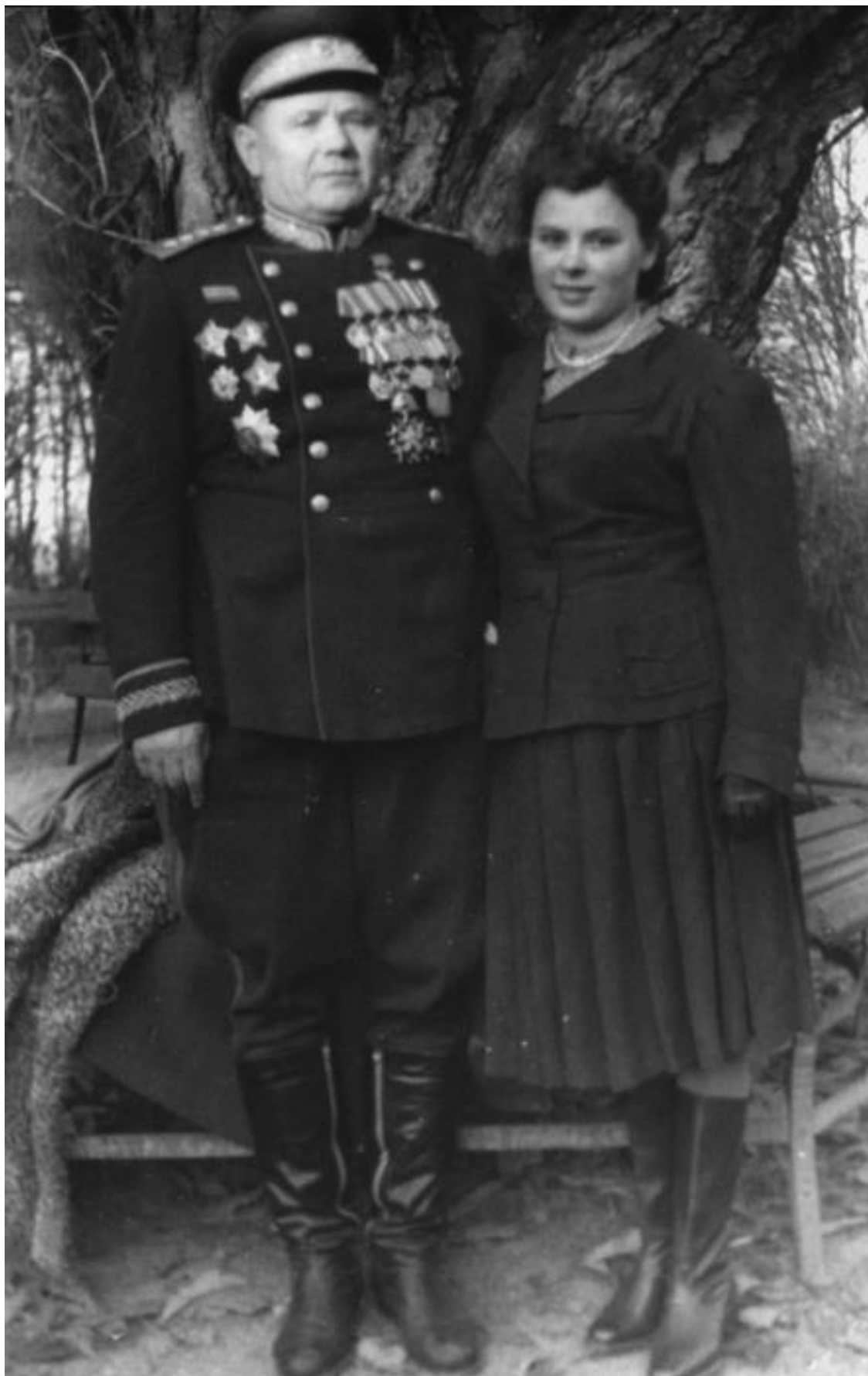
Генерал армии А.И. Еременко с супругой. Львов. 1945 г.