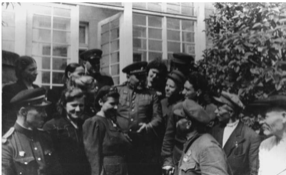
Приезд марковской делегации на 4-й Украинский фронт. Чехословакия, г. Пардубице. Май 1945 г.

В этих подарках выражалась горячая любовь советского народа к своей Красной Армии. Писали ему на фронт письма. В 1942 году марковчане подарили Сталинградскому фронту самолет, т. е. собрали деньги, построили самолет и преподнесли своему земляку – командующему фронтом.