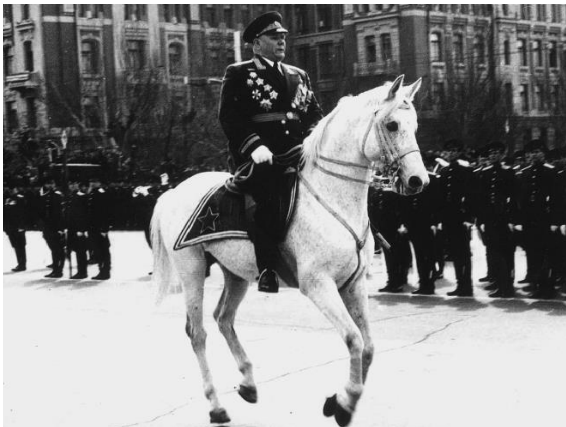
Генерал Еременко принимает парад. Ростов-на-Дону. 1954 г.

Папа – командующий Северо-Кавказским военным округом. Мне шесть лет. Впереди первый класс. Надо выбрать спецшколу – немецкую либо английскую. Выслушав мое мнение в пользу английской школы, он мягко переориентировал меня на немецкую. Сказал, что Германия – это страна величайшей культуры, а знание языка позволит мне читать в подлиннике великих немецких поэтов, писателей, философов, таких как Маркс, Энгельс, Гете, Шиллер, Гейне и других классиков. Немецкий нам преподавали со 2-го класса.