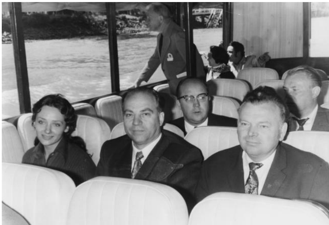
Аргентина. Буэнос-Айрес. Слева направо: Татьяна Еременко, Георгий Иванович Воробьев – председатель Комитета лесного хозяйства СССР, члены советской делегации. Октябрь 1972 г.