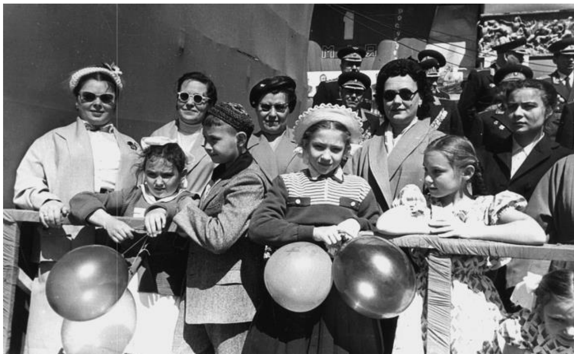
Семья маршала на трибуне во время парада 1 мая. Ростов-на-Дону. 1956 г.