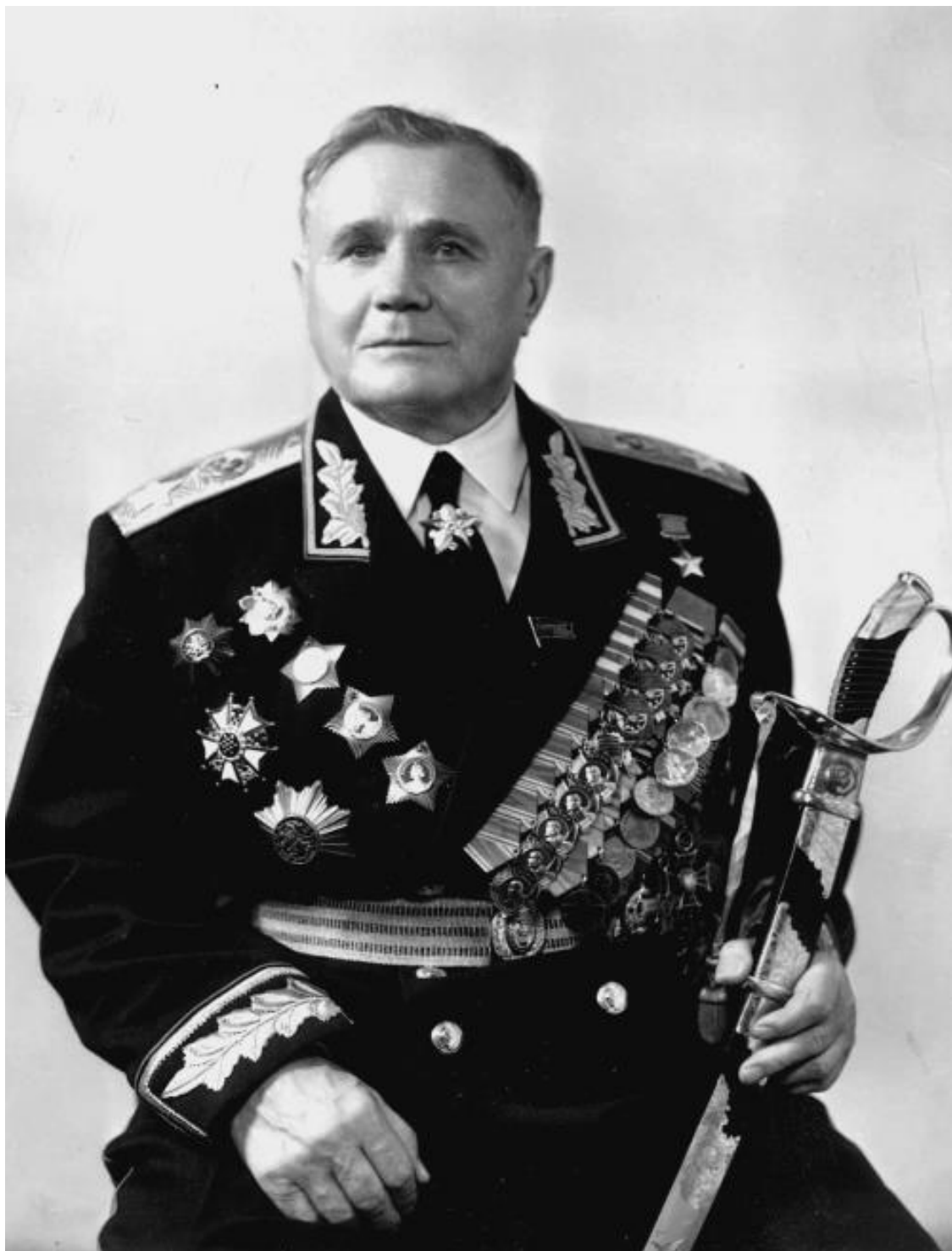
Парадный портрет Маршала Советского Союза А.И. Еременко

К 70-летию Победы (2015 г.) было издано большое количество книг о полководцах Великой Отечественной войны: Сталине, Шапошникове, Рокоссовском, Василевском, Коневе, Тимошенко, Мерецкове, не говоря уже о Жукове, которые были представлены в литературных трудах писателей-документалистов достаточно полно. Это отраднo. Но среди этого разнообразия публикаций о маршале А.И. Еременко не найти. Нет такой книги. Есть только работы самого полководца, его военные дневники и книги, включая автобиографическую повесть «Служба Родине» в двух томах, на страницах которой он увлекательно рассказывает о своем детстве, юности, учебе, службе в Красной Армии, о своем участии в двух мировых и Граждан-