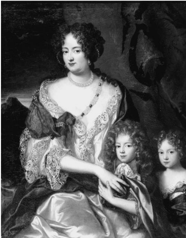
София-Доротея Брауншвейг-Целльская с детьми.