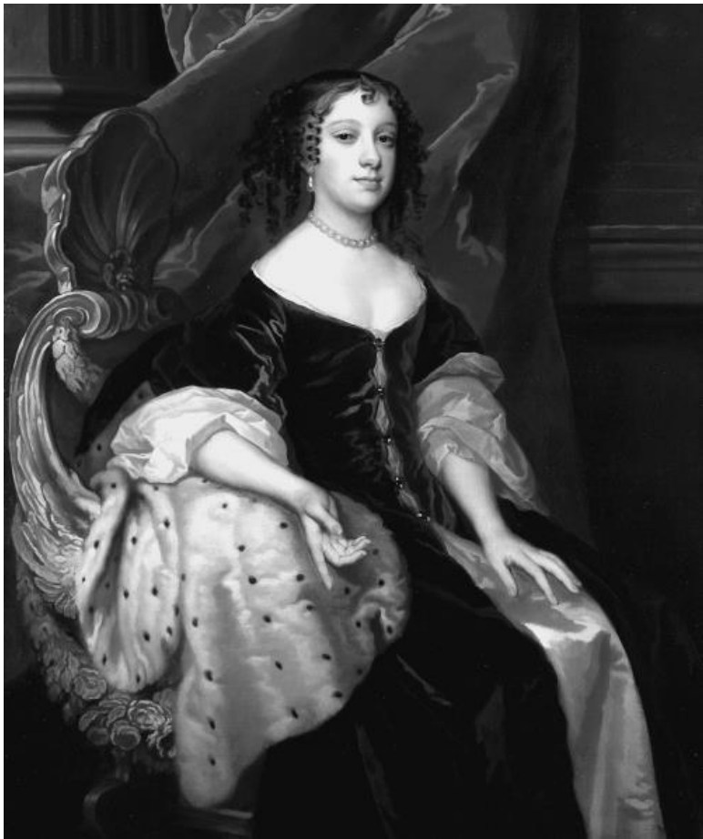
Екатерина Брагансская. Художник П. Лели

Родственники молодой королевы являлись фанатичные