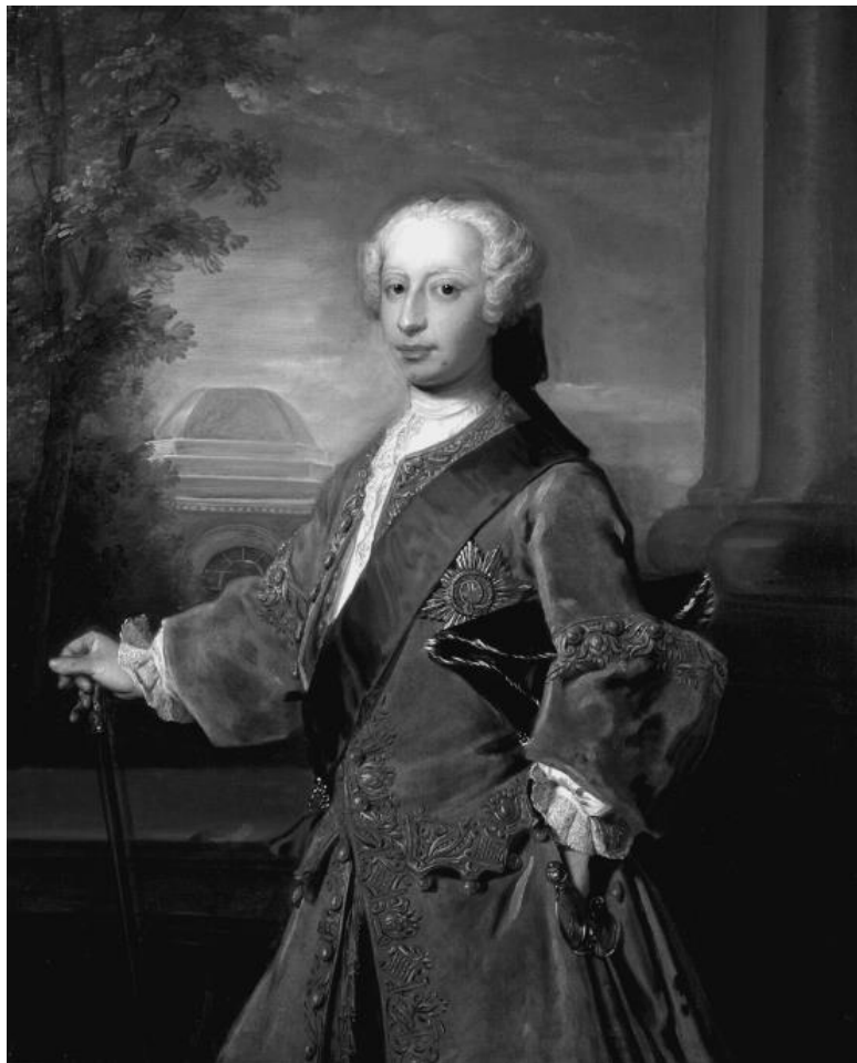
Фредерик, принц Уэльский. Художник Ф. Мерсье