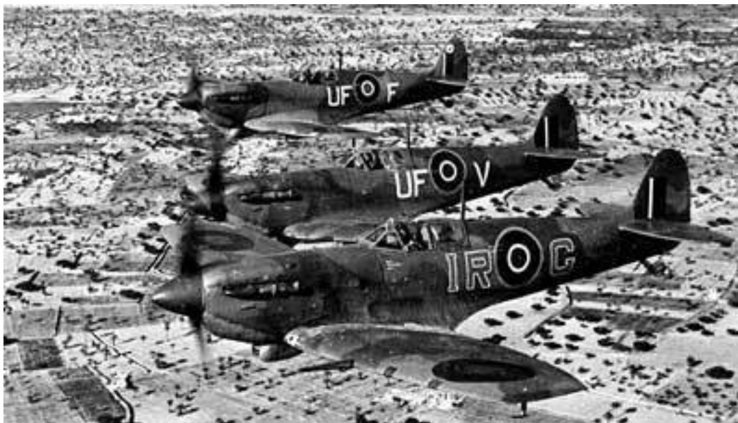
В конце марта 1940 года Франция и Великобритания приняли решение о нанесении удара по советским нефтепромыслам