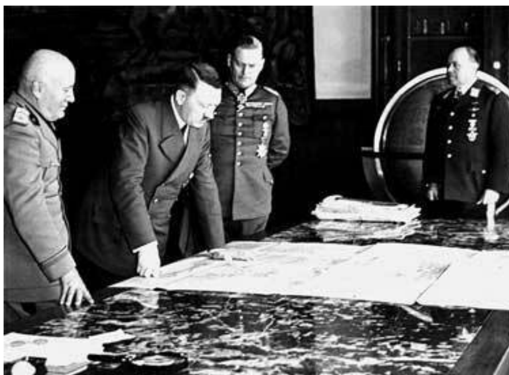
Обсуждение плана Барбаросса. 1940 г.