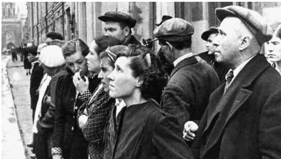
Советские люди слушают выступление В.М. Молотова по радио 22 июня 1941 г.

6. Установить количество немецких дивизий и корпусов к востоку от реки Одер, т. е. от линии Моравская – Острава – Бреслау – Штеттин. При этом особенно важно выявить состав войск в районах Ченстохов, Катовице, Краков, Лодзь, Познань, Бреслау; Познань, Франкфурт (на Одере), Бреслау.