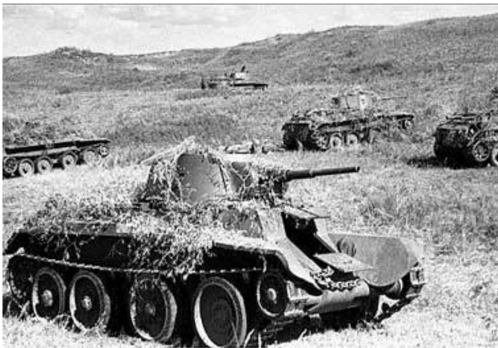
Советские танки на Халхин-Голе. 1939 г.