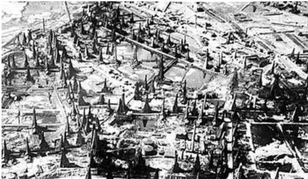
Бакинские нефтепромыслы. 1930-е гг.