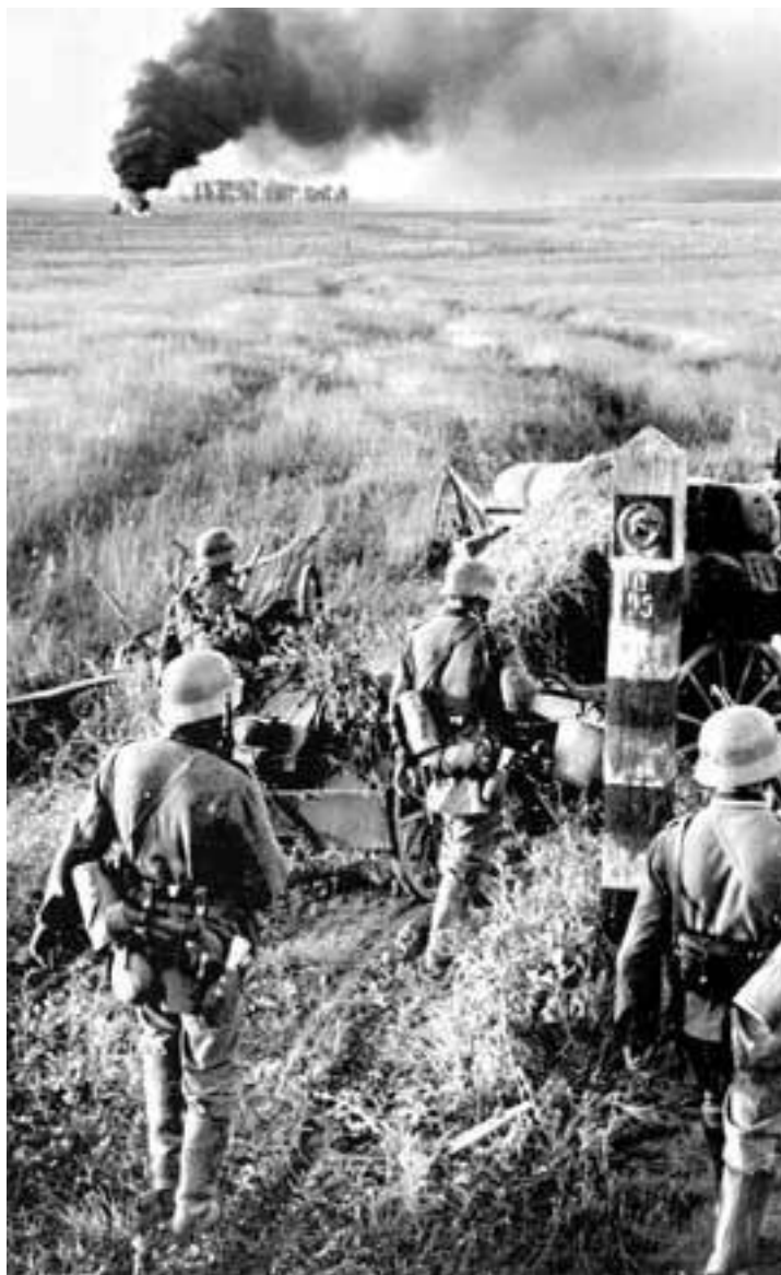
Германские войска вторгаются на территорию СССР. Июнь 1941 г.