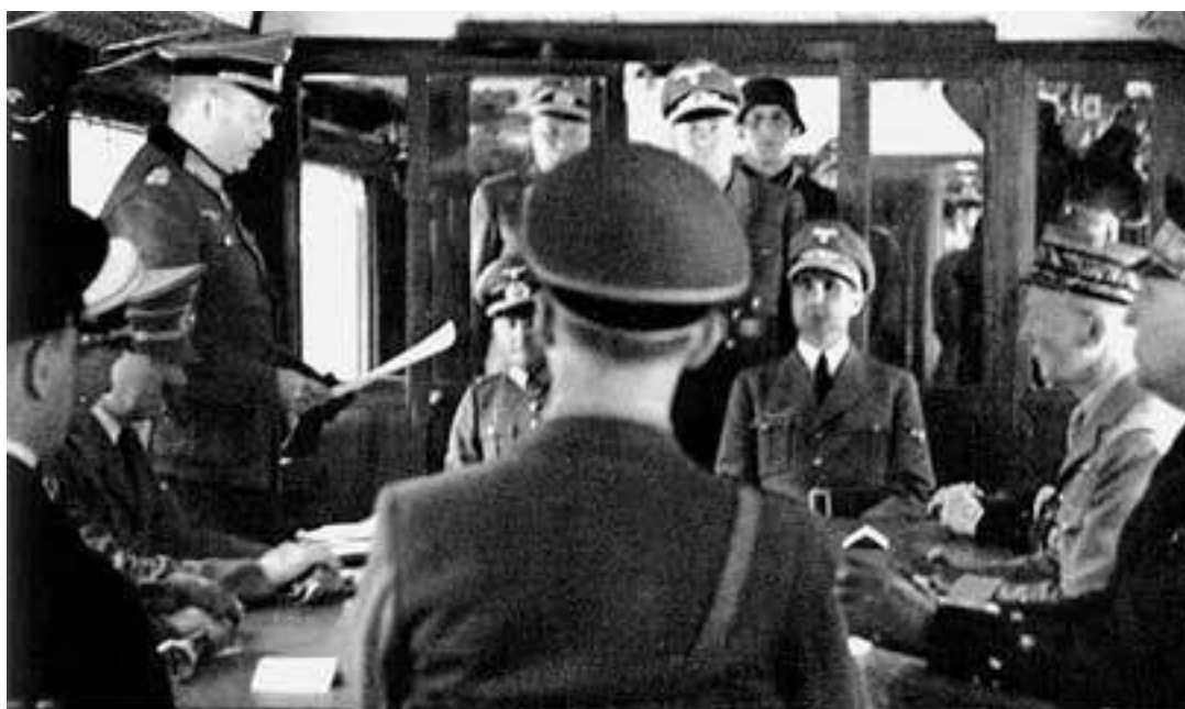
Подписание акта о капитуляции Франции в 1940 г.