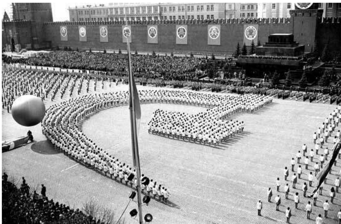
Парад физкультурников 1 мая 1939 г.