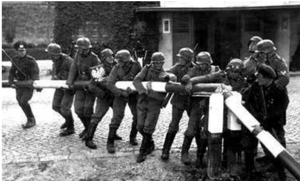
Солдаты вермахта ломают шлагбаум на пограничном пункте в Сопоте 1 сентября 1939 г.