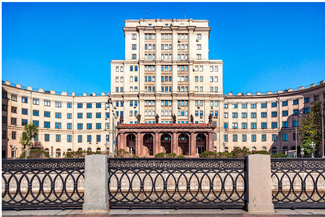
МГТУ им. Н.Э. Баумана