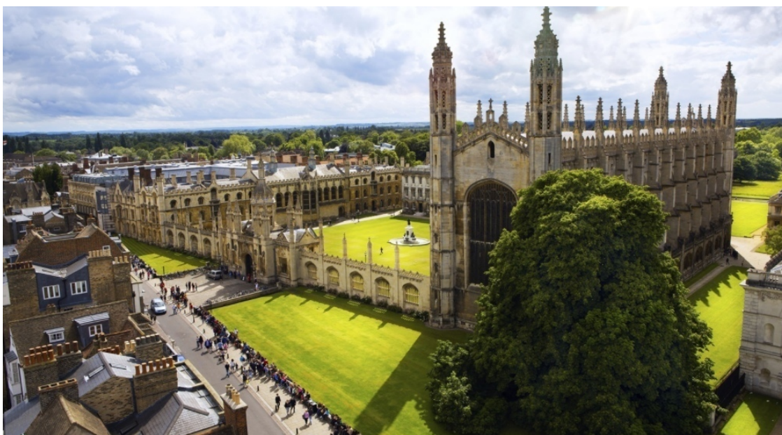
Кембриджский университет university of cambridge