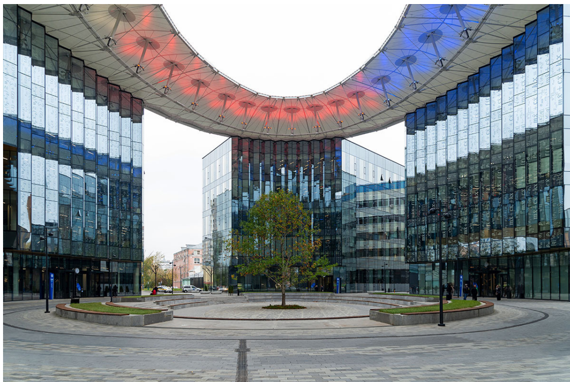
Кампус МГТУ им. Н.Э. Баумана

ЕСКД — Единая система конструкторской документации. Комплекс государственных стандартов, устанавливающих правила и требования к оформлению конструкторских документов (чертежей, схем, и т.д.)