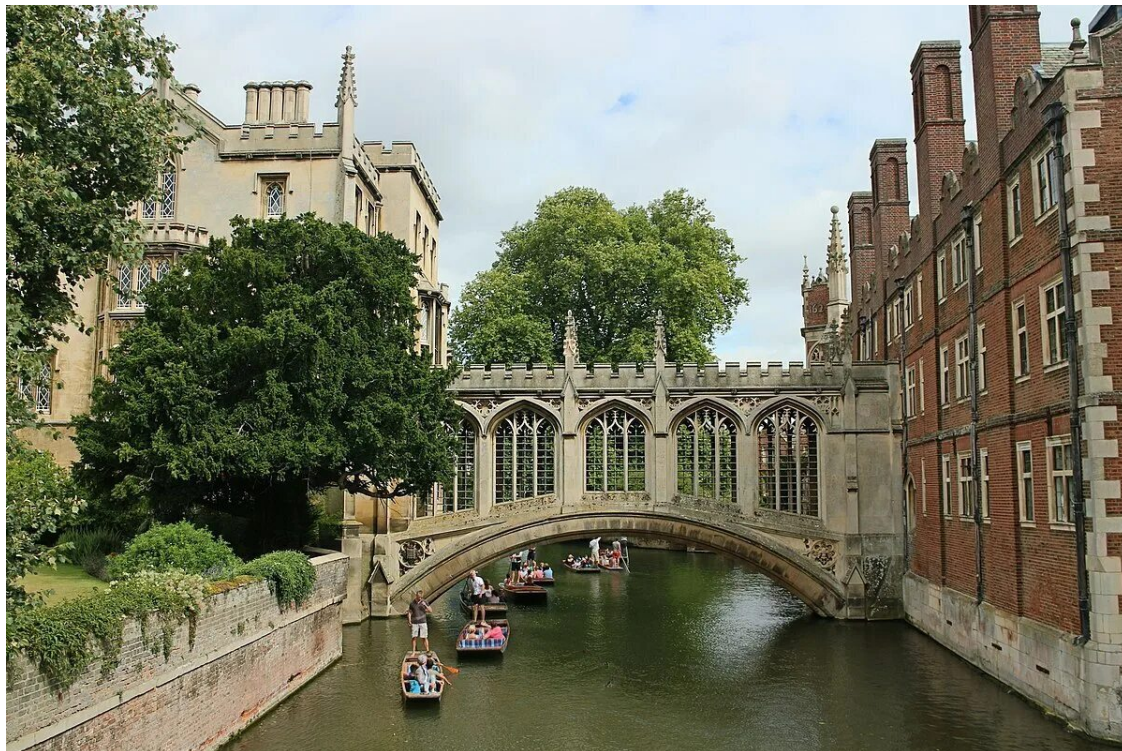
Крытый мост через реку Кэм между Третьим и Новым корпусами колледже Святого Иоанна в Кембриджском университете, Кембридж, Англия (мост Вздохов)

где сбываются мечты. Теперь арки, увитые каплями дождя, выглядели чужими, лишёнными очарования. В глазах больше не было слёз — только холодная ясность и сталь. Улыбка, если она ещё когда-нибудь появится на её лице, никогда не будет прежней. С этого дня в её жизнь не сможет проникнуть ни один обманщик, ни один человек, путающий искренность с игрой.