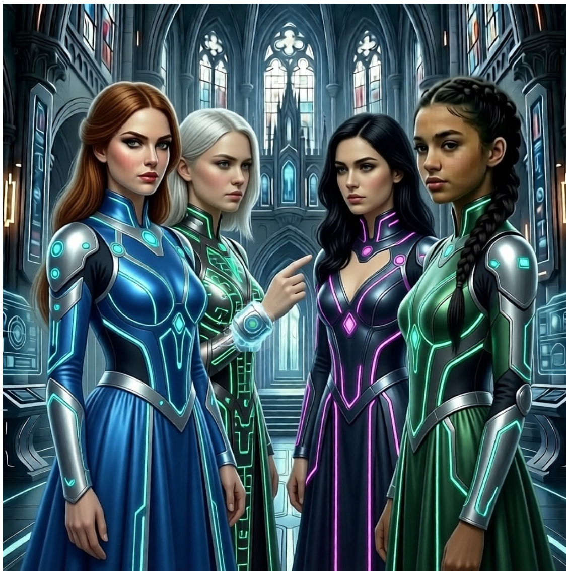
Примерно так выглядят четыре Невесты Дарена: Аэлисса с Саризэля (шатенка), Мирэла с Технориса (блондинка), Лириана с Эквиллума (брюнетка с распущенными волосами) и Киара с Велтариона (тёмные волосы, заплетённые в сложную косу)