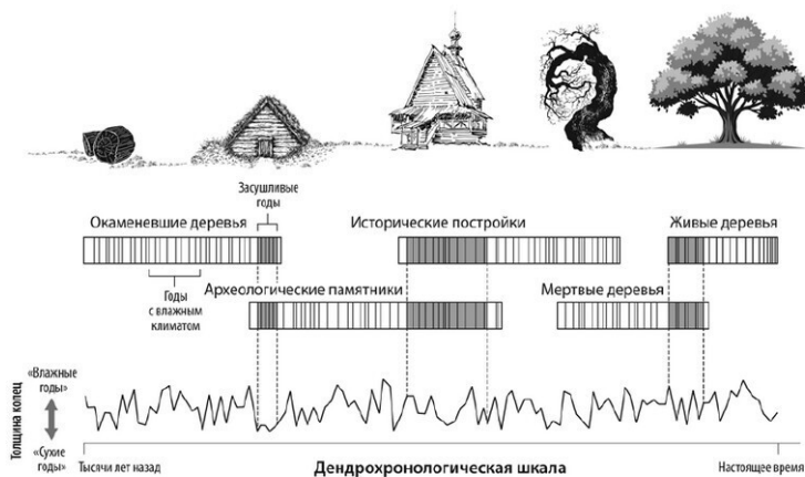
Рис. 2. Перекрестное датирование. Ученые строят шкалу для датировки, основываясь на совпадении в узоре годичных колец с одинаковой толщиной, погружаясь в прошлое по цепочке «живые деревья → мертвые деревья → ныне существующие деревянные постройки → деревянные археологические памятники → окаменевшие деревья».

Таким образом ученые действуют со времен уже знакомого нам Эндрю Дугласа. Как-никак это он заложил фундаментальные принципы метода. А базисные вещи меняются редко. Астроном не зря обратил внимание на желтую сосну. Она широко распространена в землях Северной Америки.