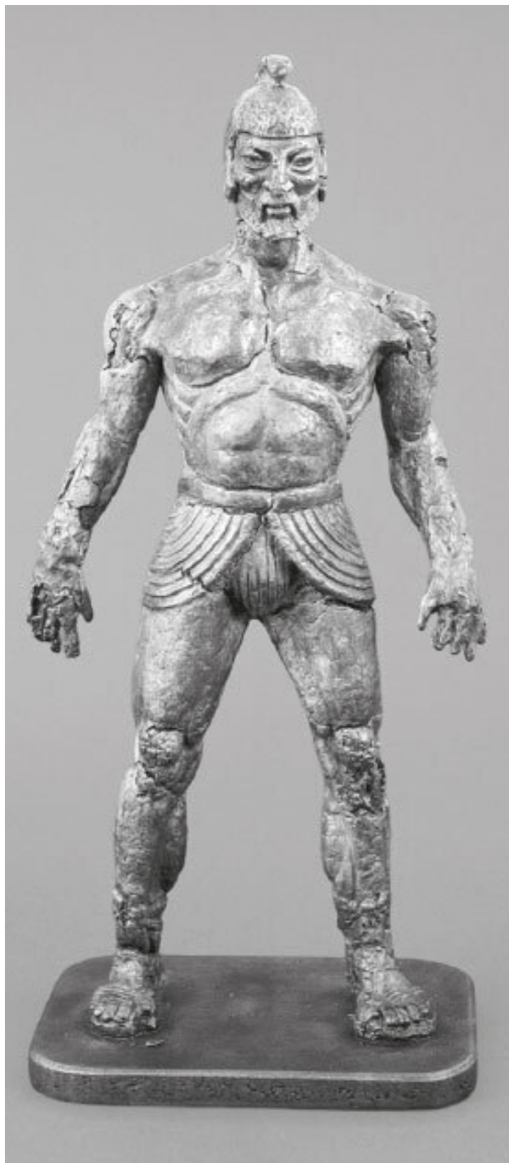
Илл. 1.1. Талос. Бронзовая отливка с разрушающейся оригинальной формы, созданная Рэем Харрихаузенем для фильма «Ясон и аргонавты» (1963). Работа 2014 года художника Саймона Фернхамма (Simon Fearnham, Raven Armoury, Dunmow Road, Thaxted, Essex, England)