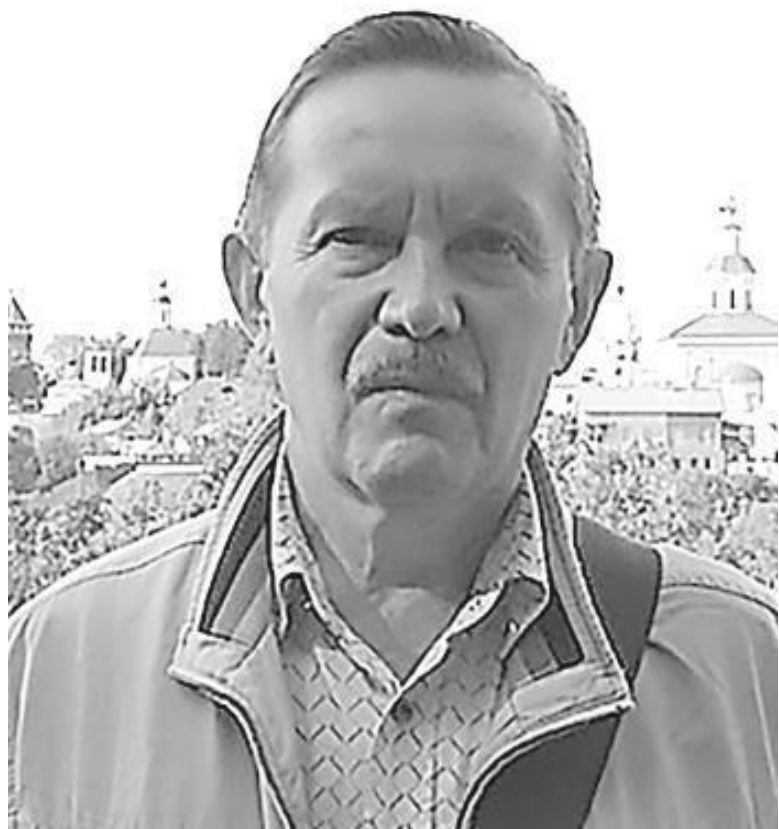
Член Союза писателей России, поэт, член литературного