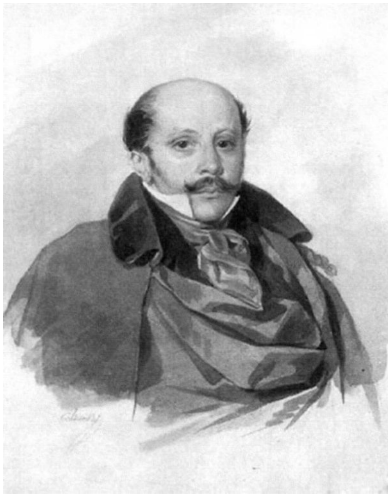
А.Д. Чертков. Акварель П.Ф. Соколова. 1830 г.