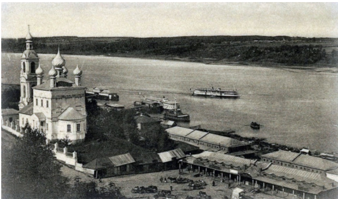
Вид с Соборной горы

Зодчие нашли оптимальное место для возведения храма – как бы на полпути в гору. Это позволило возвысить церковь над другими постройками и одновременно с тем не задавить окружающего ландшафта. От постройки того времени сохранилась невысокая ограда с каменными фигурными столбиками, украшенными сверху маленькими шариками, и Святые ворота.