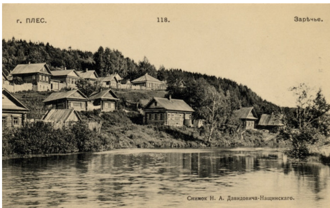
Заречная слобода 1904. Костромская губерния.

Тихий Плёс – город добротной купеческой застройки, старинных церквей и неизменно прекрасных видов на реку. Самая узнаваемая достопримечательность Плёса, так сказать, визитная карточка города – маленькая деревянная церковь на горе Левитана. Её уже почти «официальное» название – «Над вечным покоем». Именно так называется знаменитая картина И. И. Левитана, безмолвная героиня которой – живописная плесская церквушка. К сожалению, церковь, вдохновившая художника, сгорела, и в 1982 г. из села Билуково сюда, на гору Левитана, перевезли изящную Воскресенскую церковь.