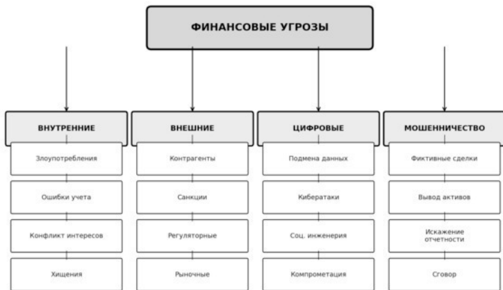
Рисунок 3 – Классификация финансовых угроз