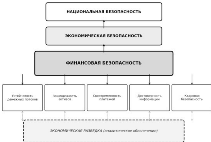
Рисунок 1 – Структура системы экономической безопасности компании

концентрация зависимости в одном звене цепочки поставок, рост использования уязвимого платежного канала или появление у приоритетного работника необъяснимых внешних доходов – все это может оставаться в пределах правового поля, однако представлять реальную угрозу для компании.