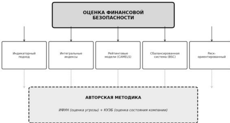
Рисунок 5 – Методологические подходы к оценке финансовой безопасности