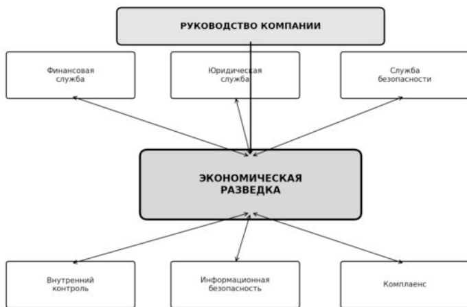
Рисунок 2 – Место экономической разведки в системе корпоративного управления

выступает основной составляющей, поскольку именно через денежные потоки и обязательства проявляется большинство корпоративных уязвимостей. Устойчивость денежных потоков, защищенность активов, платежный порядок, достоверность информации и кадровая безопасность образуют пять взаимосвязанных блоков. Экономическая разведка обеспечивает аналитическую поддержку каждого из них, обрабатывая сведения из внутренних и внешних источников.