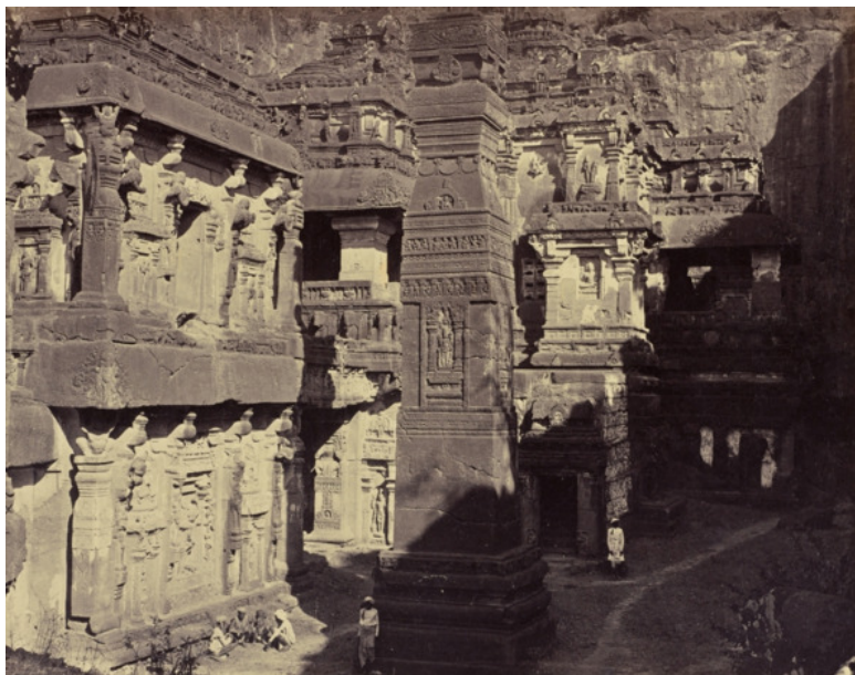
Рисунок 3. Храм Кайласанатха, Индия

чем строил эти мегалиты, и... продолжили жить, будто ничего не произошло. Им что, память всем разом отшибло? А мы теперь гадаем: как и зачем всё это создавалось? Странно, правда? Но об этом чуть позже, до пирамид и мегалитов мы ещё доберёмся.