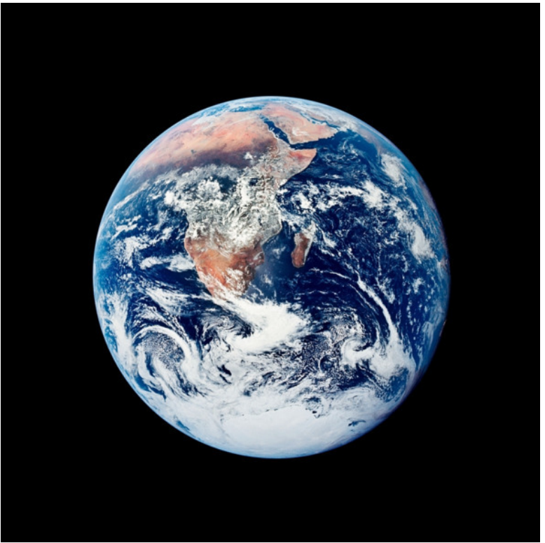
Рисунок 1. Земля

Звучит как стройная картина, не правда ли? Но есть одна существенная деталь, которую эта картина обходит стороной. Науке до сих пор неизвестно ни одного способа, как из неживой материи создать живой организм. Мы умеем разбирать живые клетки на молекулы, мы умеем синтези-