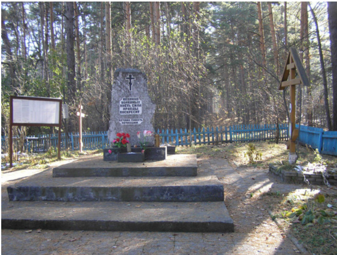
Мемориал на некрополе в ленточном бору возле Барнаульской тюрьмы.

жен памятный знак (открыт 20 августа 1991 г.). С этого времени некрополь жертв репрессий в Барнауле существует и имеет охраняемый законом статус.