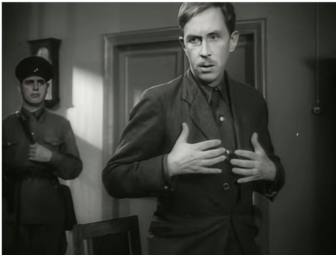
«Я – Волков! Меня послало Братство Русской Правды!» Фильм «на границе», 1938.

Обобщающим современным трудом о БРП можно считать книгу проф. Петра Базанова. В нем упоминается многочисленные попытки проникновения Братства на советскую территорию (преимущественно, на Западе, Северо-Западе и Дальнем Востоке), основанные, в значительной мере на провинциальных архивах ФСБ РФ. При этом автор признает в наследии БРП и существенную вымышленную составляющую. Так, говоря о «Русской правде», он признает, что «разделы, посвященные внутрироссийским боевым операциям, относятся к чисто саморекламе, мало имеющей общего с реальной действительностью» [207].