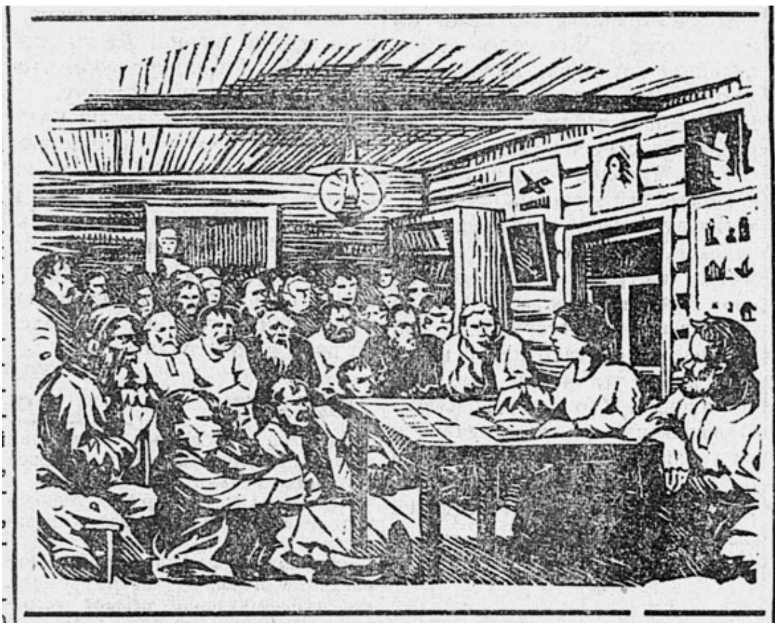
Гравюра: женщина-агитатор в красном уголке [4, 1926, 21 февраля].