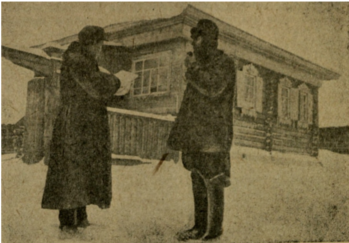
Активист проводит учет изымаемого у крестьянина имущества, конец 1929 г., с. Бугры [266, 1930, №2, с.39].

Однако, к финалу года все стало значительно хуже. С осени 1929 г. в СССР был запущен процесс насильственного сгона крестьян в разного рода «коллективы» (достигший пика в марте 1930 г.).