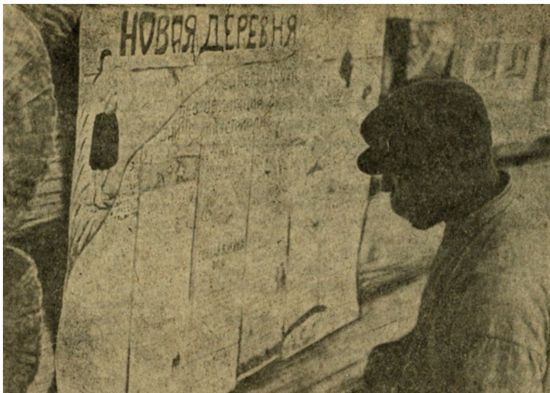
Сибирский коммунар читает стенгазету, агитирующую «за Советскую власть» [266, 1929, №1, с.43].

Это свидетельствует об эффективности уже выстроенной к тому времени Советским режимом системы контроля над информационными потоками.