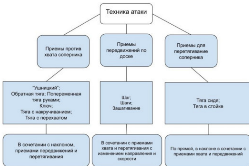
Рисунок 6 – Классификация техники атаки