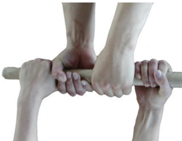
Рисунок 2а – Правый хват

Правый хват – это когда правая рука берет палку снизу, а левая – сверху (рис. 2 а), следовательно, левый хват – это когда левая рука берет палку снизу, а правая – сверху, независимо от внутреннего или наружного хвата (рис. 2 б).