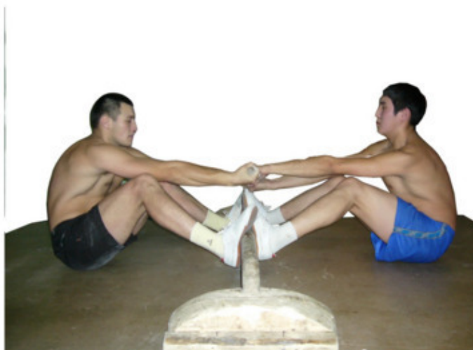
Рисунок 3 – Исходное положение спортсменов на старте

2. Туловище наклонено вперед, ноги в коленном суставе согнуты, примерно на 110^{\circ} — 160^{\circ} ; такое положение используется, когда до старта спортсмены сидят при обоюдном натяжении, и меньше шансов упустить соперника на старте (рис. 4).