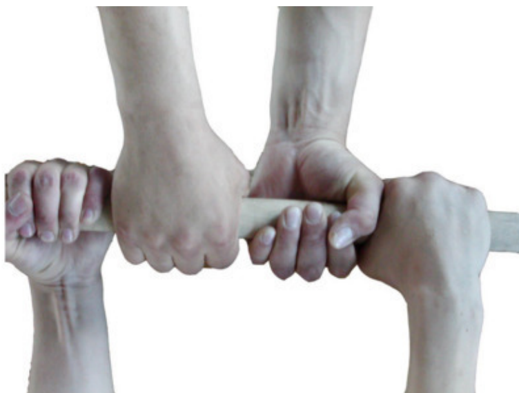
Рисунок 2б – Левый хват

Обычно в схватках по мас-рестлингу оба спортсмена используют или правый, или левый хват, но в некоторых случаях спортсмены пользуются разными хватами, т.е. наружный – правый хват, а внутренний – левый хват или наоборот (рис. 2 в).