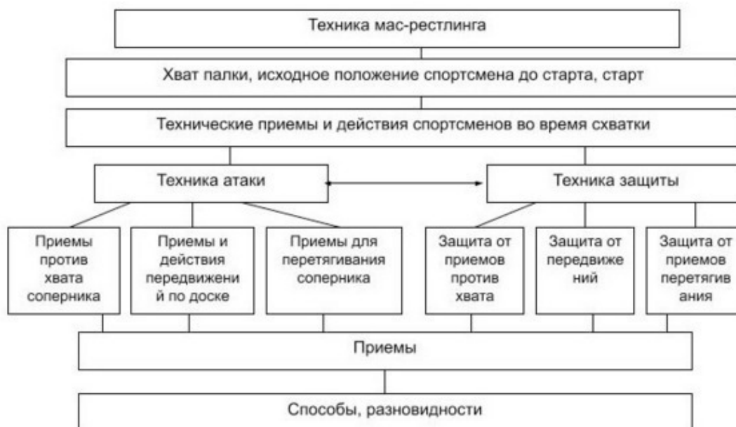
Рисунок 1 – Классификация техники мас-рестлинга