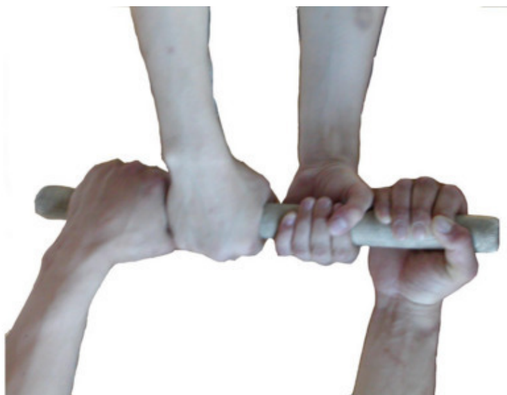
Рисунок 2в – Разный хват

Обычно в схватках по мас-рестлингу оба спортсмена используют или правый, или левый хват, но в некоторых случаях спортсмены пользуются разными хватами, т.е. наружный – правый хват, а внутренний – левый хват или наоборот (рис. 2 в).