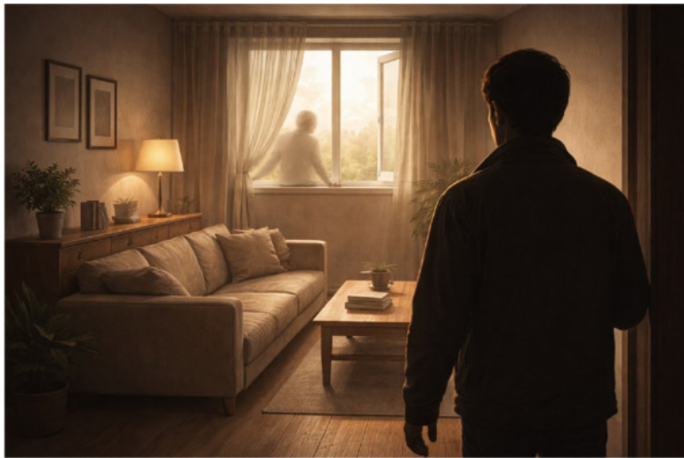
Рисунок 1. Метафора «комнаты» и реальность «по-умолчанию»

Но однажды – быть может, сейчас, читая эти строки – Вы задаете себе вопрос: а я выбирал эту комнату?