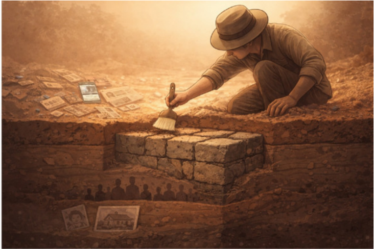
Рисунок 3. Фундамент вашей реальности закладывали другие. Археология — первый шаг: увидеть, кто и когда это сделал.

Вы перестаете быть пассажиром, который даже не знает, что сидит в чужом автомобиле. Вы становитесь тем, кто хотя бы посмотрел на карту .