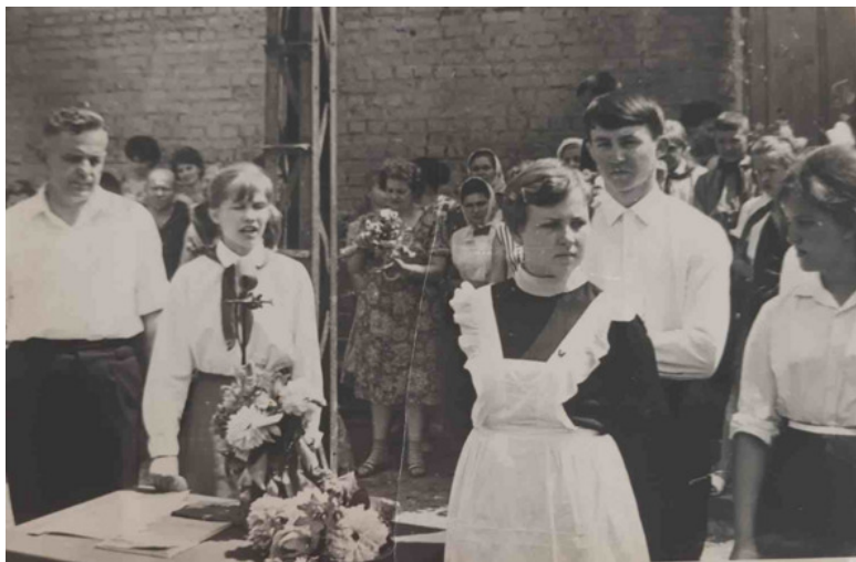
На линейке в честь Последнего звонка.