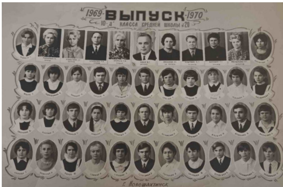
Выпуск 10-А класса

Смотрю на старую фотографию, на которой написано: «Выпуск 10-А класса средней школы №20 – 1970 год», вижу знакомые лица одноклассников и незабываемые лица наших учителей.