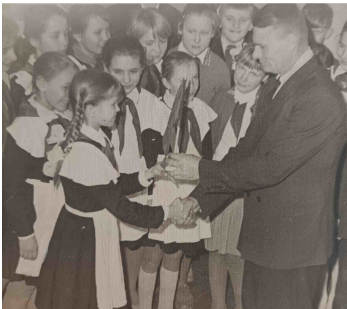
На пионерском сборе

Я тоже всегда любила общественную работу. В 5-ом классе меня выбрали председателем совета отряда, позже – председателем совета дружины.