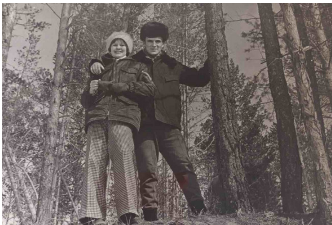
С мужем в забайкальском лесу

Мы были счастливы. Квартира на пятом этаже только что сданного дома №170. Большие светлые комнаты, стены окрашены в желтый и салатовый цвет, окна на лес. Будем любоваться закатом. Прекрасно.