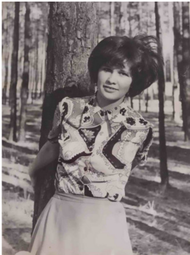
В солнечном Забайкалье. По пути в школу. Сентябрь 1974 г.