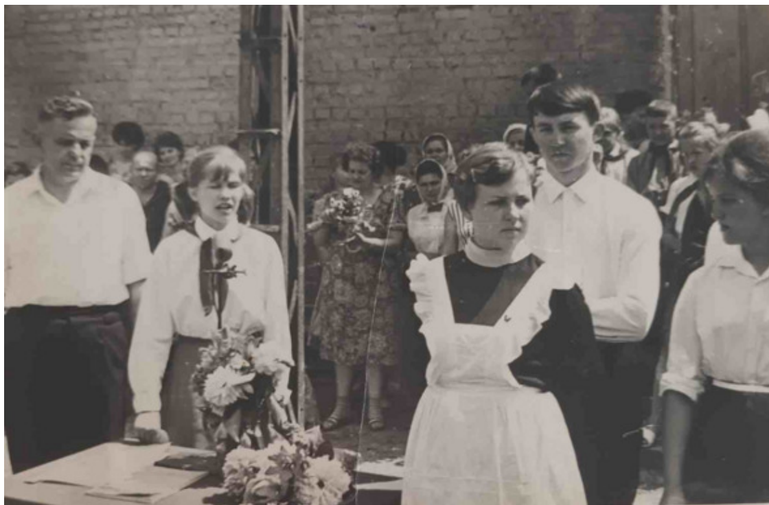
На линейке в честь Последнего звонка. Поздравляю выпускников

Но вот отгремели школьные годы, прозвенел для нас последний звонок. Мы успешно окончили 10 класс, и сразу серьезнее и взрослее стала шеренга девятиклассников. Теперь они стали хозяевами школы, они будут сидеть в классах за нашими партами. И на них будут строго смотреть с портретов русские писатели и великие ученые, как смотрели на нас.