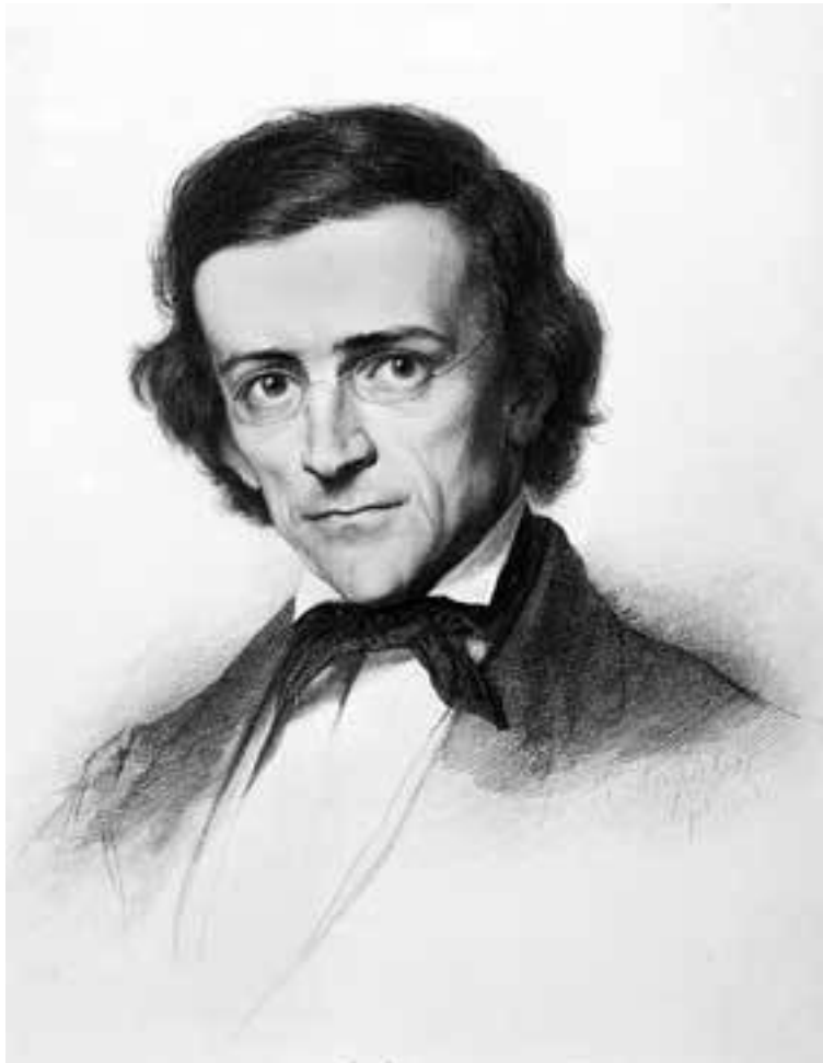
Теодор Моммзен. Портрет работы Л. Якоби. 1863 г