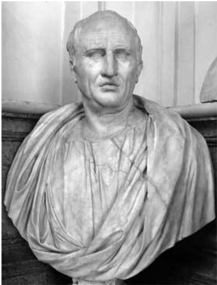
Бюст Цицерона. Сер. I в. н.э. Капитолийские музеи. Рим