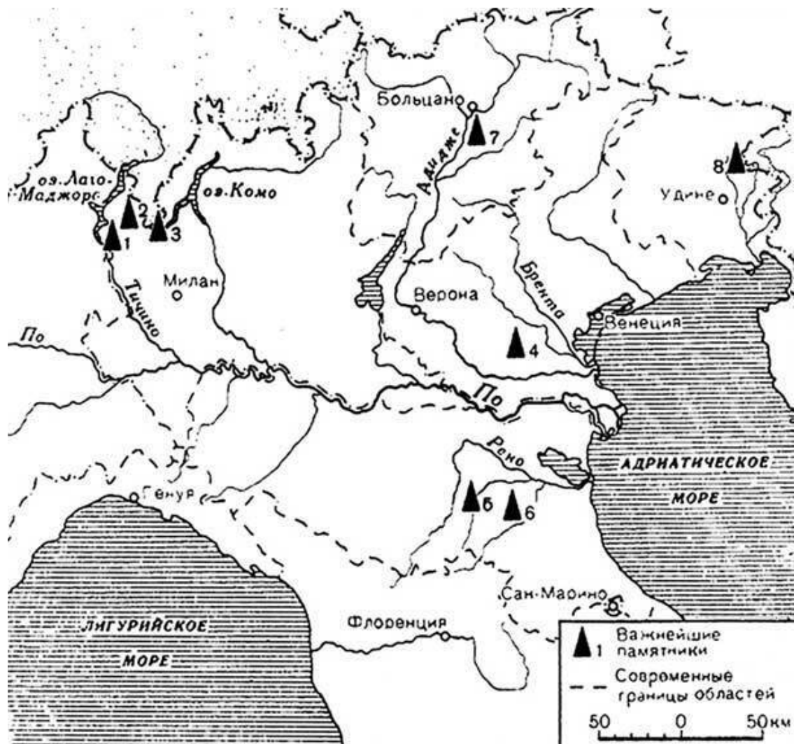
Важнейшие памятники раннего железного века в Северной Италии. 1. Голасекка. 2. Варезе. 3. Комо. 4. Есте. 5. Вилланова. 6. Тосканелла-Иммолезе. 7. Вадена. 8. С. Лучия

В извлечениях из географического словаря Ἑθνικά Стефана Византийского, представляющего собой компиляцию многих не дошедших до нас трудов, под словом χῖος мы узнаем, что Ἴταλιῶται (очевидно, италики в узком смысле этого слова) покорили пеласгов и превратили их в рабов. Мы узнаем также, что пеласги жили в Лукании (Plin., N. H., III, 71), Лациуме (Plin., N. H., III, 71, Verg., Aen., VIII, 600), Северном Пицене (Silius Italic., Pun., VIII, 443). Несомненно, ареал распространения пеласгов в Италии преувеличен древними авторами. Возможно, что они называли пеласгами всех выходцев с Балканского полуострова – не греков, и под пеласгами следует понимать, например, япигов 88 . Однако нельзя полностью отрицать сведения о пеласгах, как это делал Модестов, относивший пеласгов к области греческой фантазии 89 . Наличие балканских неиндоевропейских элементов подтверждается данными топонимики, а длительная связь с Балканами – археологией 90 . Разумеется, вопрос о пеласгах в настоящее время не может считаться решенным. Следует ожидать, что дешифровка микенской письменности