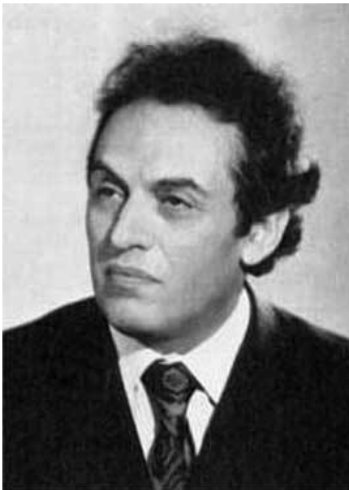
А. И. Немировский – советский и российский историк Древнего Рима и этрусской культуры

Но одновременно появился новый обильный материал, обогативший наши представления о начале истории Рима и Италии. Этот материал дала археология. Подобно сказочному Антею, прикоснувшись к земле, наука восстановила и укрепила свои силы, истощенные длительной и не всегда плодотворной критикой римской литературной традиции. Чем дальше идет археологическое исследование древнейшей Италии, тем отчетливее видно, что значение археологического материала не ограничивается интерпретацией тех фактов, которые содержат литературные источники. Археология выдвигает многие самостоятельные проблемы и помогает их решению.