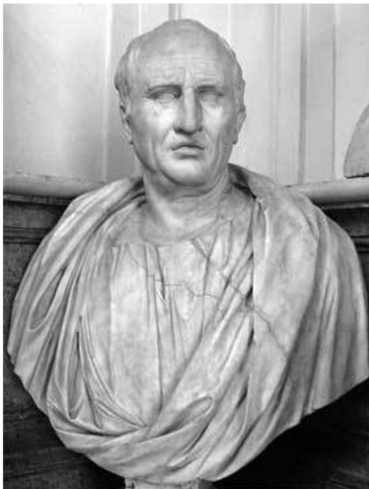
Бюст Цицерона. Сер. I в. н.э. Капитолийские музеи. Рим

Такая установка заставляет Цицерона рассматривать деятельность всех римских царей, начиная с Ромула. Цицерон не только останавливается на таких «событиях» царствования Ромула, как основание Рима и похищение сабинянок, но и рассматривает взаимоотношения Ромула с сенатом и народом. Подробно освещает Цицерон деятельность царей этрусской династии. Цицерон принимает версию, согласно которой Тарквиний Древний был сыном коринфянина Демарата. Из приписываемых Тарквинию Древнему мероприятий Цицерон выделяет реформу конницы, его войны с эквами и сабинами, основание храма Юпитера Капитолийского.