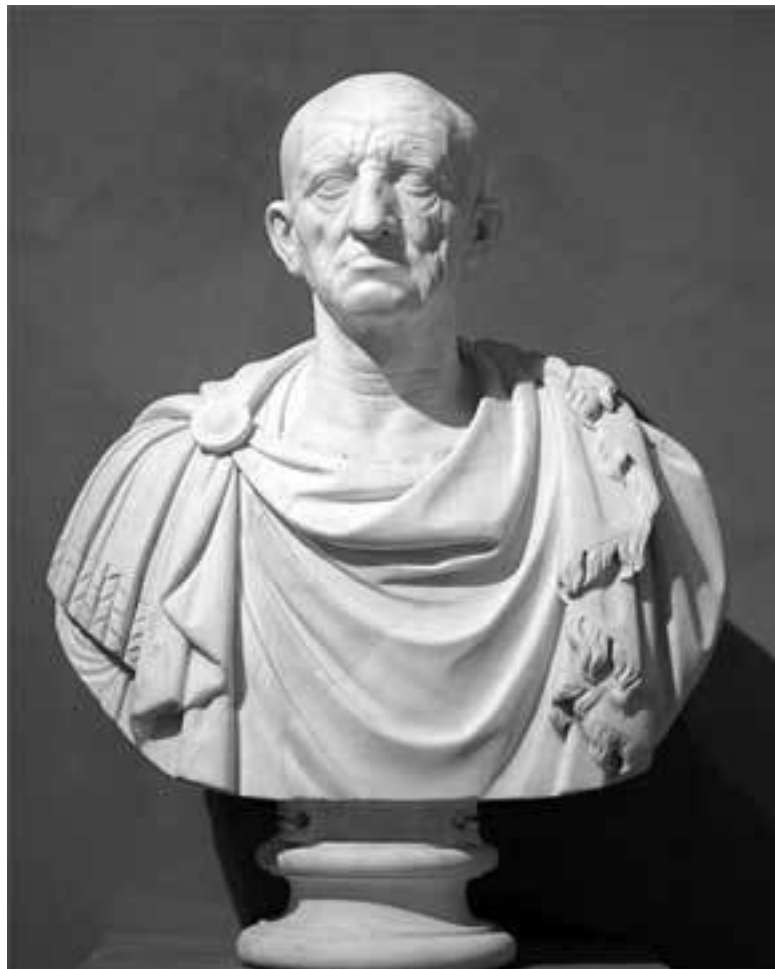
Марк Порций Катон Старший (предполагаемый портрет). 80-е гг. до н.э. Рим. Музей Торлониа

Первым римским историком, писавшим на латинском языке, был Марк Порций Катон Старший (234–149 гг. до н. э.). Его историческое сочинение «Origines» состояло из 7 книг. Оно обнимало историю Рима от основания до времени Катона 53 . Корнелий Непот так передает содержание этого труда: «Первая книга содержит деяния царей народа римского ( res gestas regum populi romani ), вторая и третья – откуда началось каждое италийское государство, вследствие чего и все сочинение, кажется, он озаглавил «Origines». В четвертой говорится о Первой Пунической войне, в пятой – о Второй» (Cato, 3, 3).