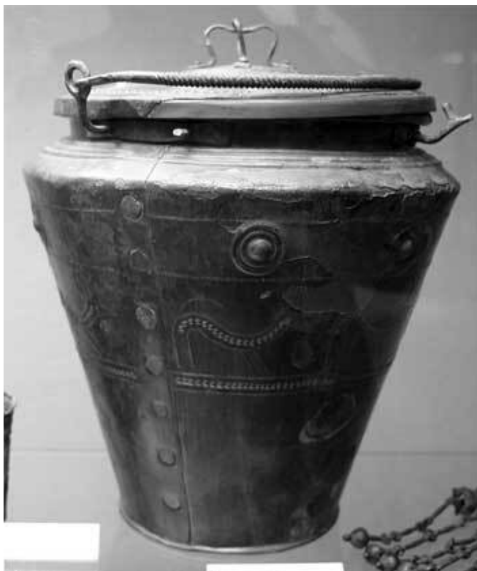
Культура Голасекки. Бронзовая ситула с крышкой. Около 590–490 гг. до н.э.

Похоронный инвентарь погребений Голасекки, особенно первого периода, беден. Кроме урны, покрытой чашей, находят всего лишь один сосуд или фибулу. Оружие встречается редко. В некоторых могилах первого периода имеются бронзовые наконечники копий. В могилах второго периода находят железные наконечники копий. Исследователи отмечают близость форм керамических и бронзовых изделий второго периода Голасекки и третьего – Эсте (Эсте), что говорит о развитии обмена во второй период.