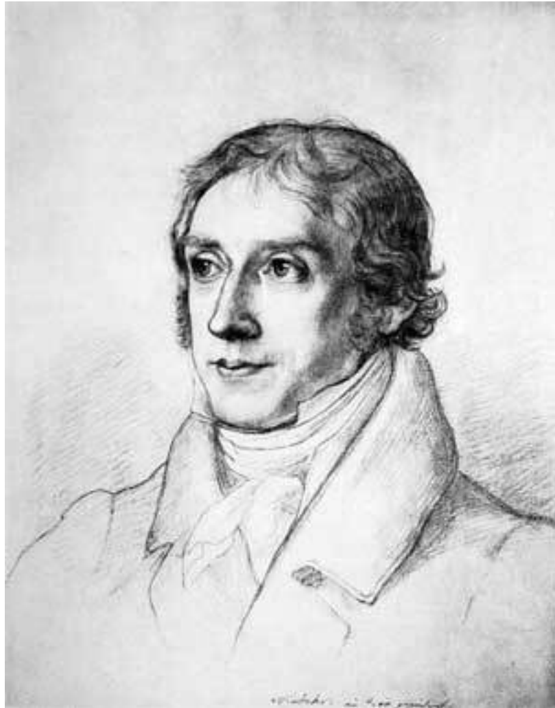
Бартольд Георг Нибур – датско-немецкий историк античности. Портрет до 1831 г.

Гипотеза о народных песнях как источнике римской традиции не является новой. Ее выдвинул уже Перизоний. Приверженцами ее были Бофор и Вико. Но никто из них не пытался отделить несохранившиеся песни ( carmina ) от риторических прикрас, принадлежащих поздним писателям. Это делает Нибур. Не ограничиваясь утверждением, что carmina были важнейшими источниками римской традиции, объясняющими обилие поэтических деталей, Нибур пытался выяснить происхождение этих песен. Он считал их выражением взглядов римских плебеев, в то время как анналы представляли, по его мнению, патрицианскую точку зрения.