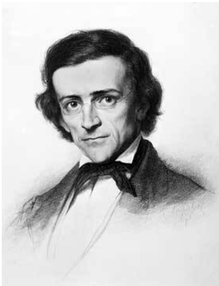
Теодор Моммзен. Портрет работы Л. Якоби. 1863 г

В своих работах «Римская хронология», «Римские исследования», «Римское государственное право», «Римское уголовное право» и др. Моммзен осветил различные вопросы истории, права, экономики, культуры, хронологии раннего Рима 18 . В этих трудах Моммзен тщательно анализирует источники, проявляя громадную эрудицию в области филологии, права, нумизматики, эпиграфики.