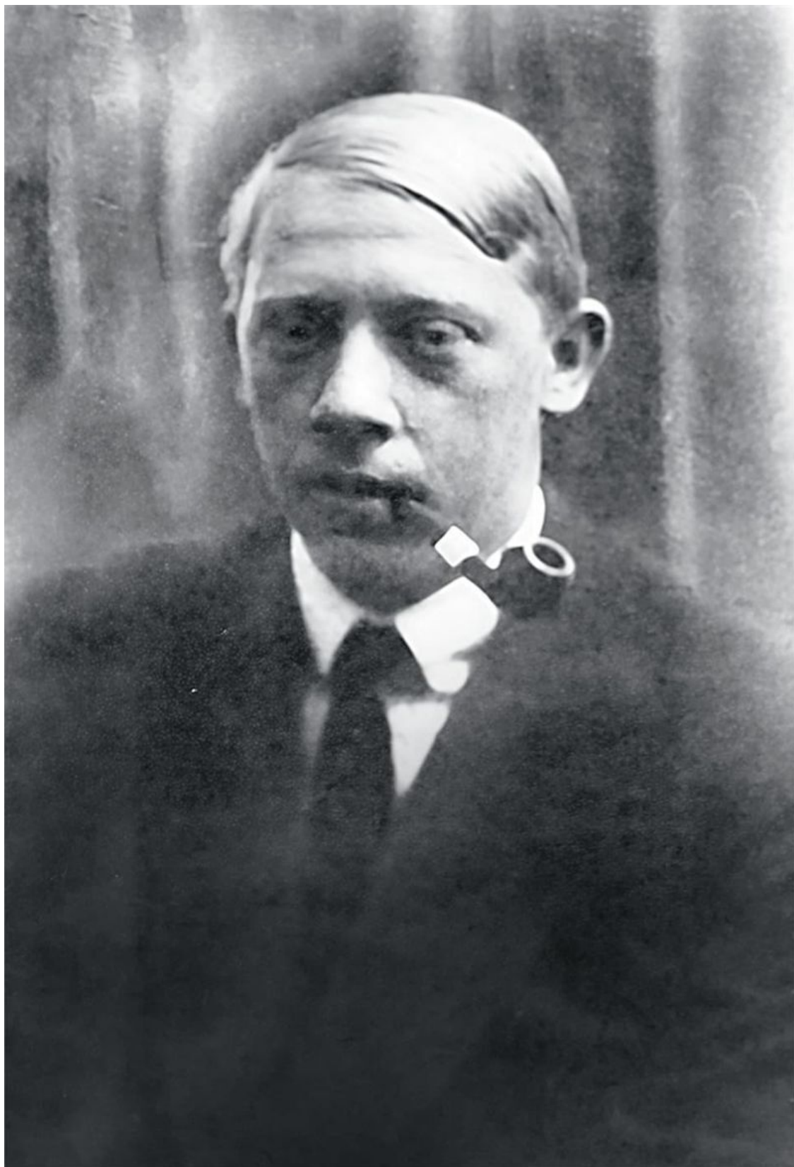
Владимир Татлин. Фотография. Москва, 1911.