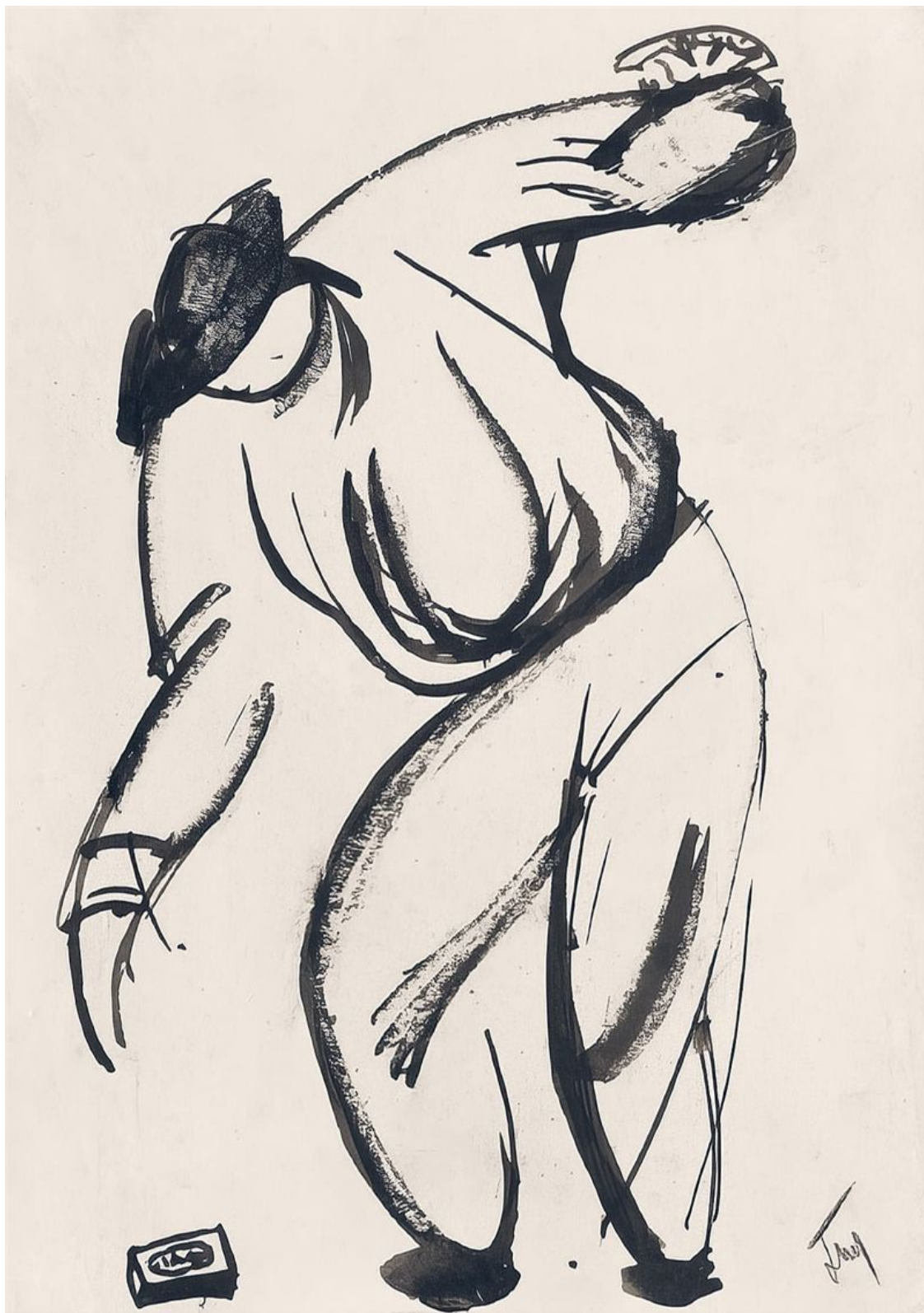
Владимир Татлин. Поднимающий спички. Начало 1910-х. Бумага на картоне, тушь, кисть. 26×18 см

шими «Натурщицами», рядом рисунков, остается относительно, по строгим меркам внешним, почти проблематичным.