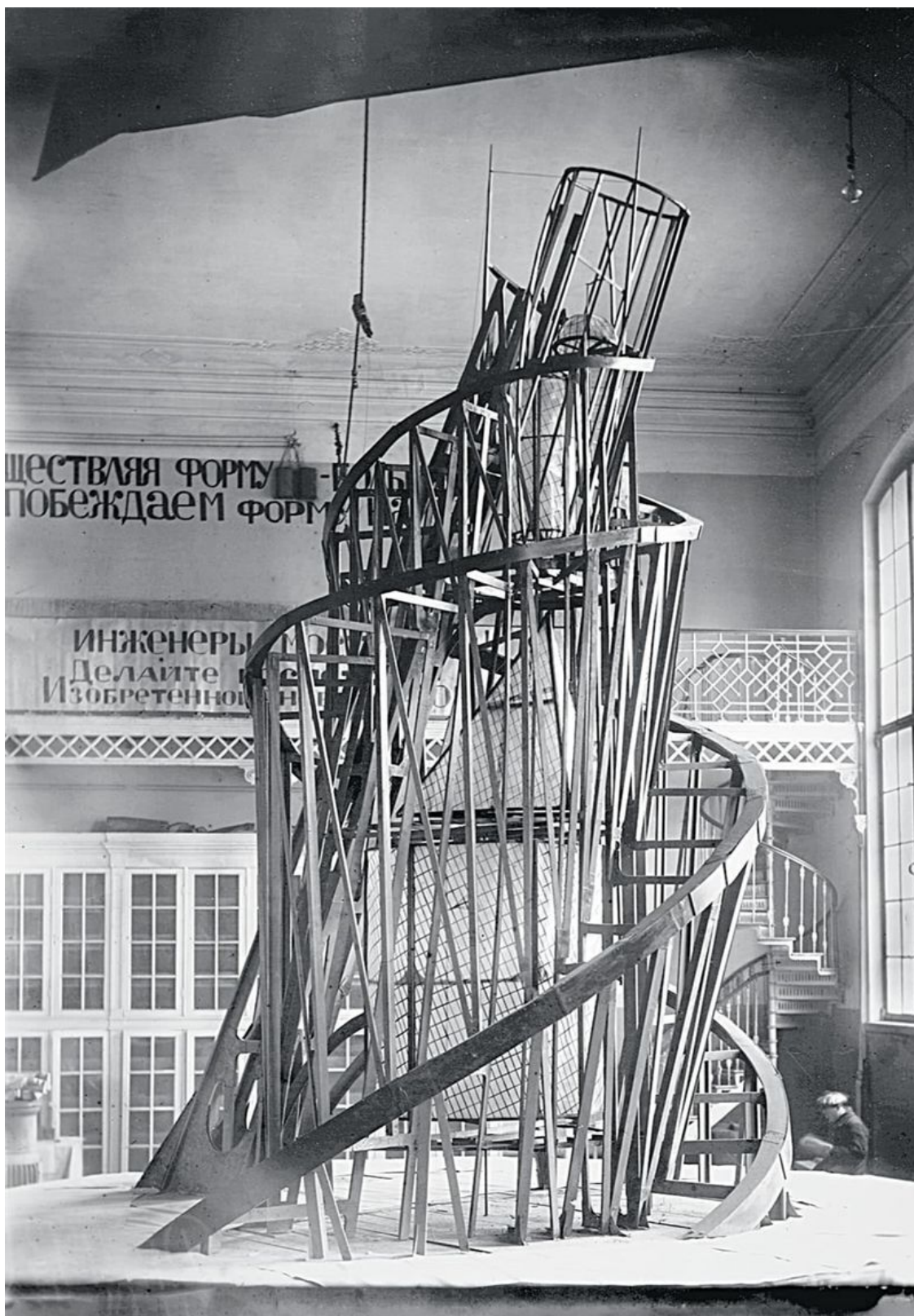
Владимир Татлин. Модель «Памятника III Интернационалу» в мозаичной мастерской Академии художеств. Фотография. Ноябрь 1920. Стекло, черно-белый негатив

Взгляды на искусство подлинных административных руководителей советской культуры, начиная с Луначарского, ни разу не совпали с татлинскими, и ни одна сторона не сделала в этом смысле шага навстречу другой.