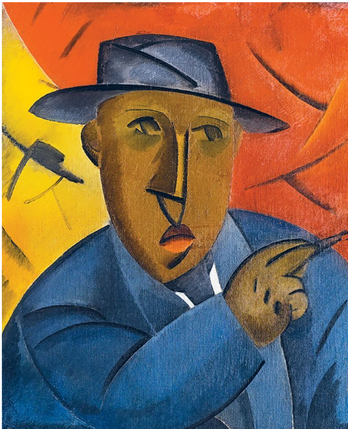
Владимир Татлин. Портрет художника (Автопортрет). 1912. Холст, масло. 106×88,8 см

Кубизм, что тоже общеизвестно, оказался одним из решающих импульсов для русского авангарда: он стал важной предпосылкой русского кубофутуризма, «татлинизма» (с его контррельефами), супрематизма, повлиял на ряд других направлений. При этом в большинстве случаев кубизм был воспринят главным образом как камертон новой стилистики, вне своей философии и системности. Россия не дала «хороших» эпигонов подлинного кубизма: Татлин, Малевич, Розанова, Попова, Экстер, Клюн, Родченко и другие ведущие художники русского авангарда, ассимилировавшие – каждый на свой лад – какие-то идеи и черты кубизма, сознательно устремляли волю на поиск своеобразных пластических решений.