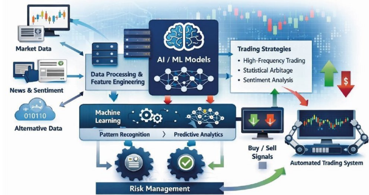
Рис. 1. Пример применения AI/ML в алгоритмической торговле