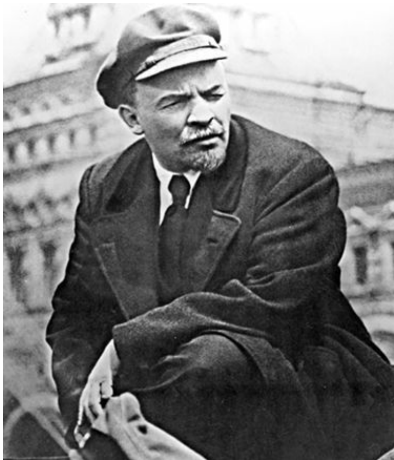
Владимир Ильич Ленин на празднике войск Всевобуча (Всеобщее военное обучение). Первомайская демонстрация. Красная площадь. 1919 год