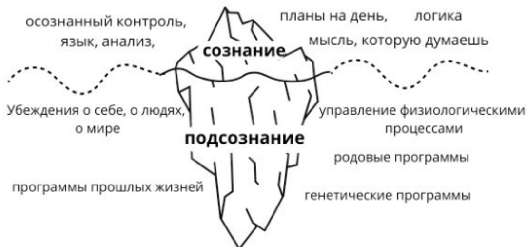
схема подсознания и сознания