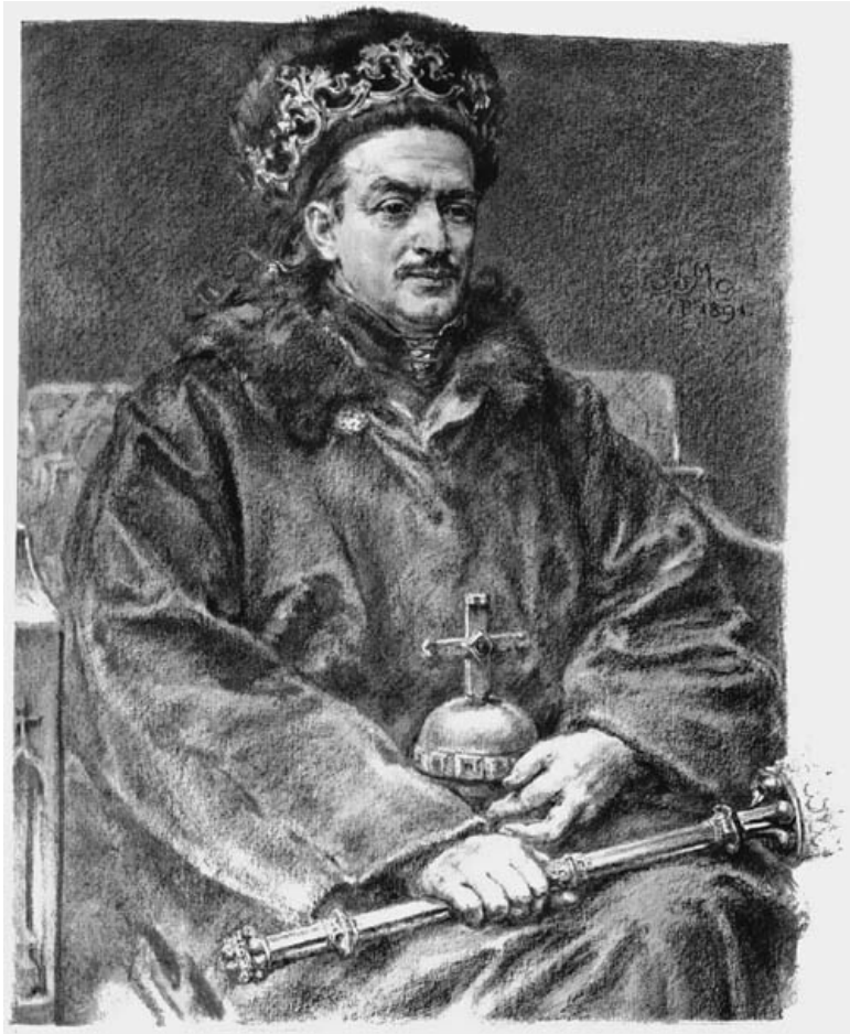
Казимир IV. Художник Я. Матейко