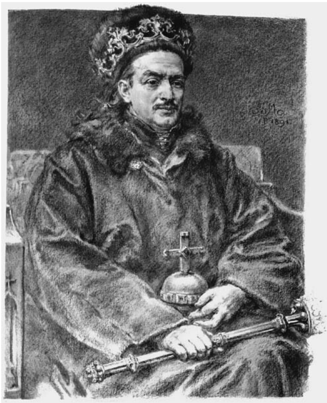
Казимир IV. Художник Я. Матейко

Уставные грамоты великих князей литовских постоянно подчеркивали принцип сохранения старины во всех областях местной жизни, ссылаясь при этом на практику времени Витовта. «Бо мы, – заявлял уряд о своих принципах в управлении, – старины не рушаем, а новины не вводим, хочем все по тому мети, как было за великого князя Витовта и за Жикгимонта» (киевская земская грамота). В тех же почти выражениях высказан этот принцип и в грамоте киевским мещанам «и всим есмо пожаловали мещан киевских и все посполство по давному, как было за великого князя Витовта: бо мы никому новины не велим уволити, а старины рухати».