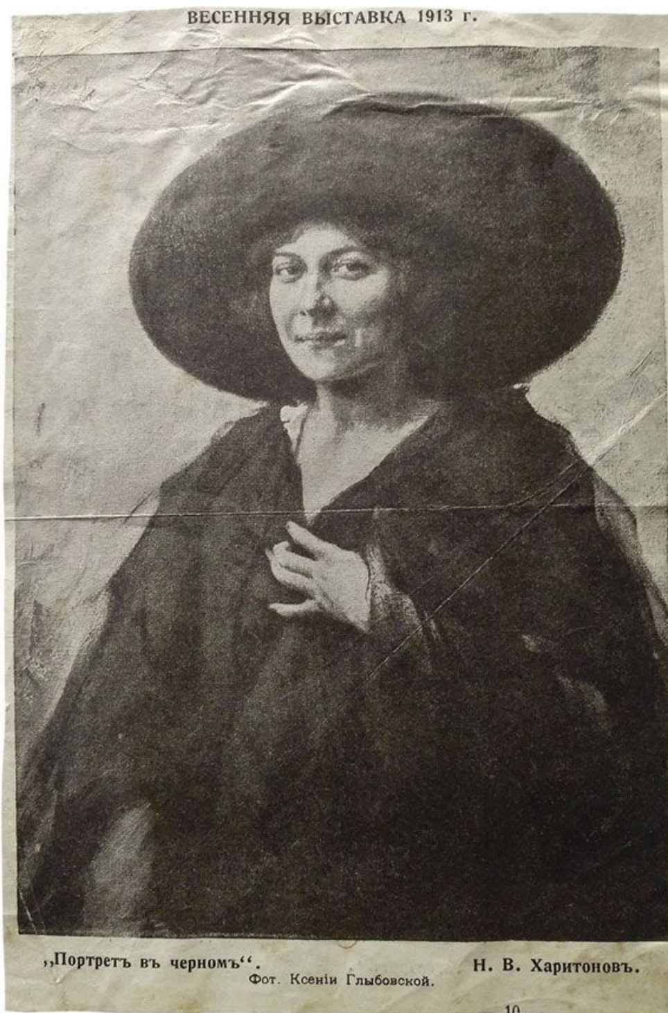
Н. Харитонов Портрет в черном. 1913

Фото с весенней выставки в залах Императорской Академии художеств, Санкт-Петербург