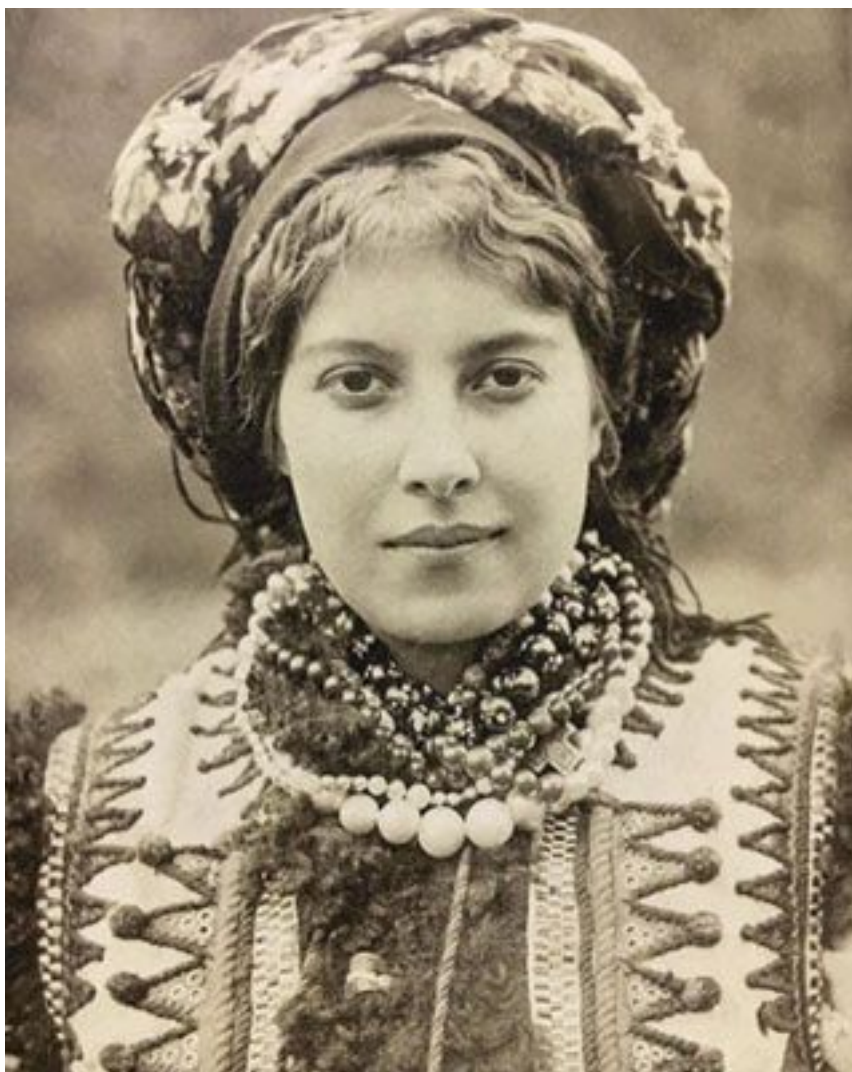
Ксана в гуцульском костюме. 1911, Карпаты

Влеча ужа в своих перстах. Коса желта, морями многая, И рыба песня на устах. А сзади кожи нет у ней, Она шиповника красней. И красносумрачный мешок Торчит, из мяса и кишок, И спереди, как снег, бела она, И сзади кровь, убийство и война. Ужасный призрак и видение, Улыбки ж нету откровеннее. О, как свирепы эти чары, О <них> учили песни стары.