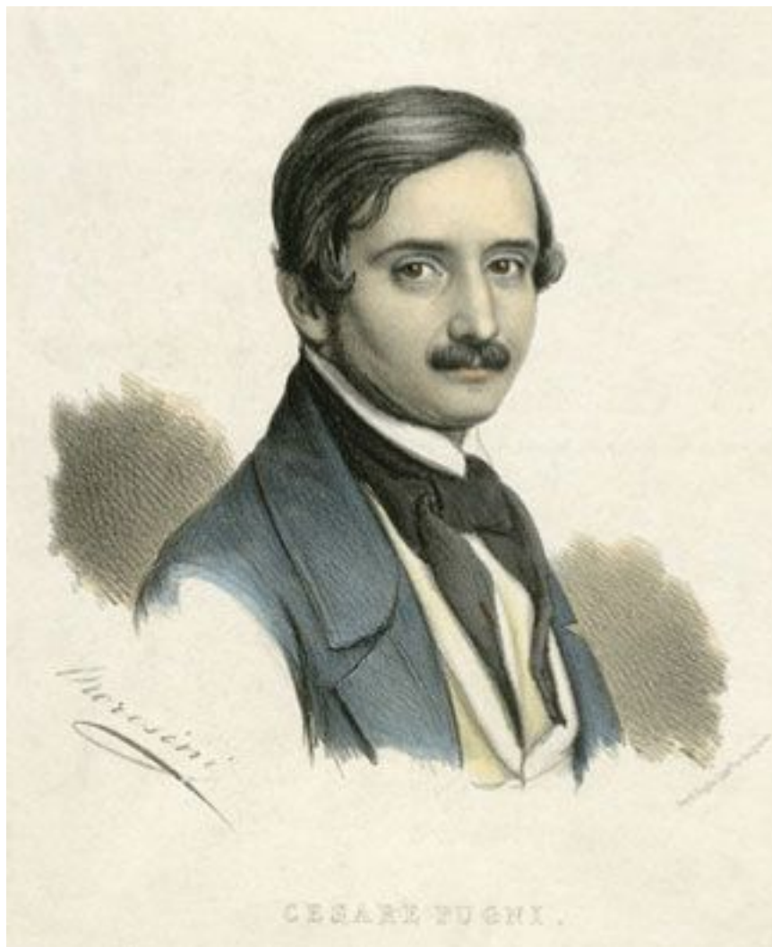
Композитор Цезарь Пуни, дед художника. Ок. 1845, Лондон Литография по рис. Дж. Моросини. Собрание А. Родионова, Санкт-Петербург