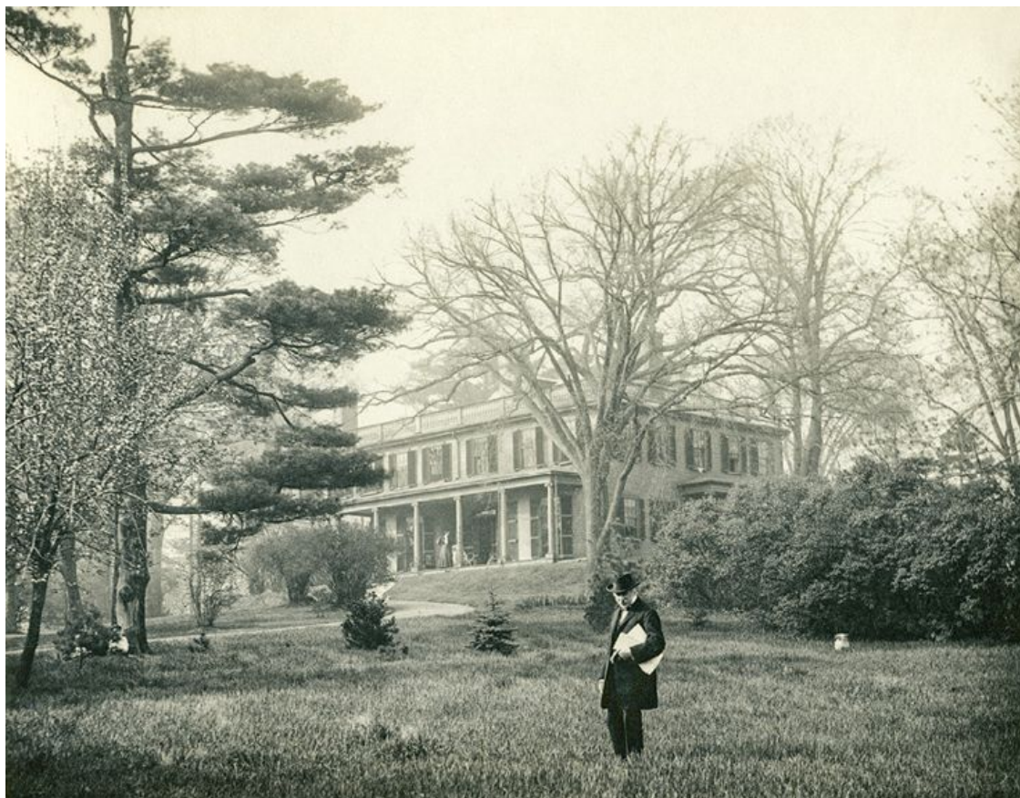
Чарльз Элиот Нортон в Шейди-Хилл Художественный музей Фогга, подразделение Гарвардских художественных музеев

фелло, Джеймс Рассел Лоуэлл и Оливер Уэнделл Холмс. Они совместно выработали понятие «хорошего вкуса» как защиты от грубости современной им жизни Нового Света. Недовольство, которое вызывал у Нортон подьем коммерции в США, укрепило его решимость сохранить нравственный статус искусства.