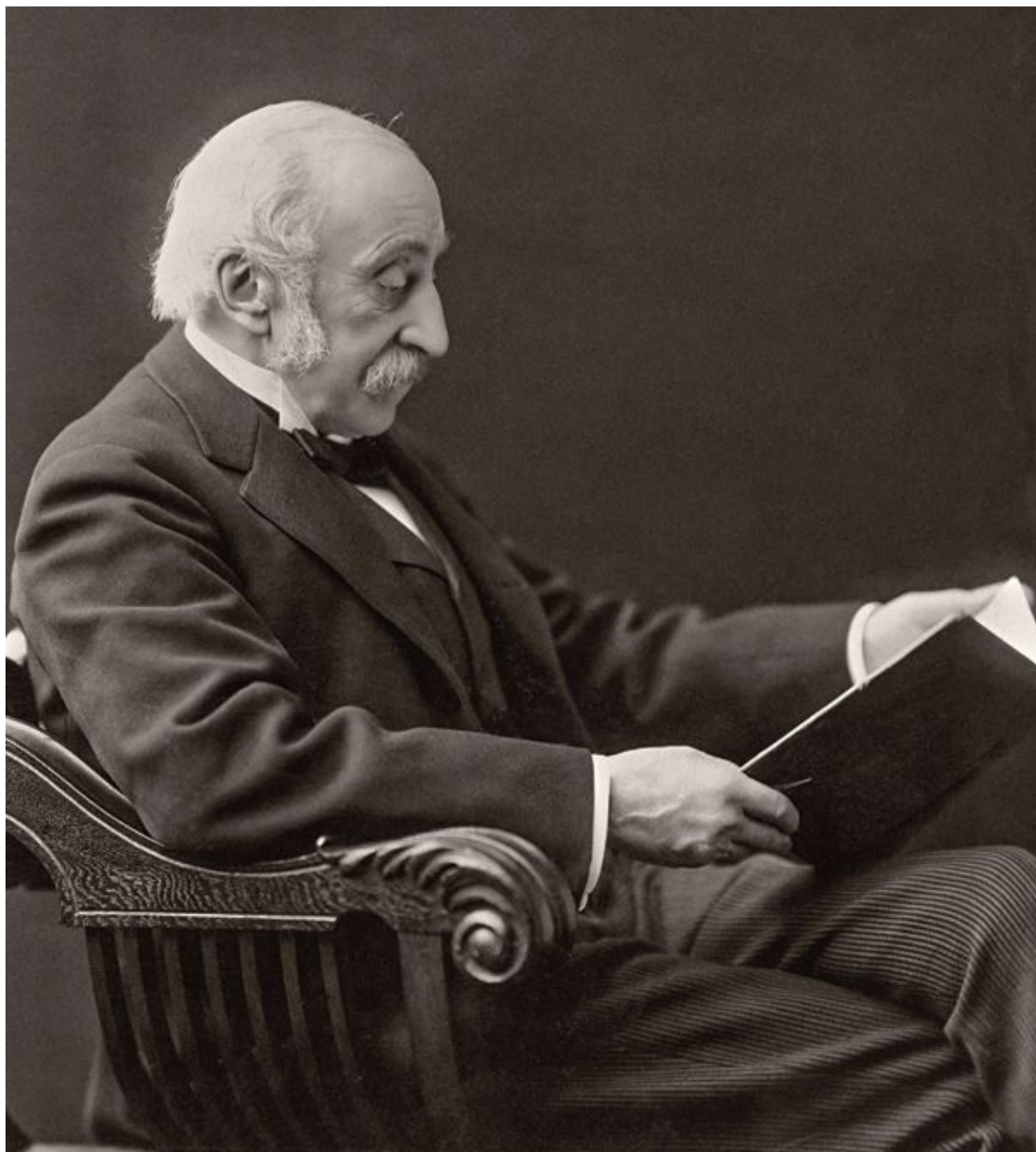
Чарльз Элиот Нортон. 1903

Художественный музей Фогга, подразделение Гарвардских художественных музеев