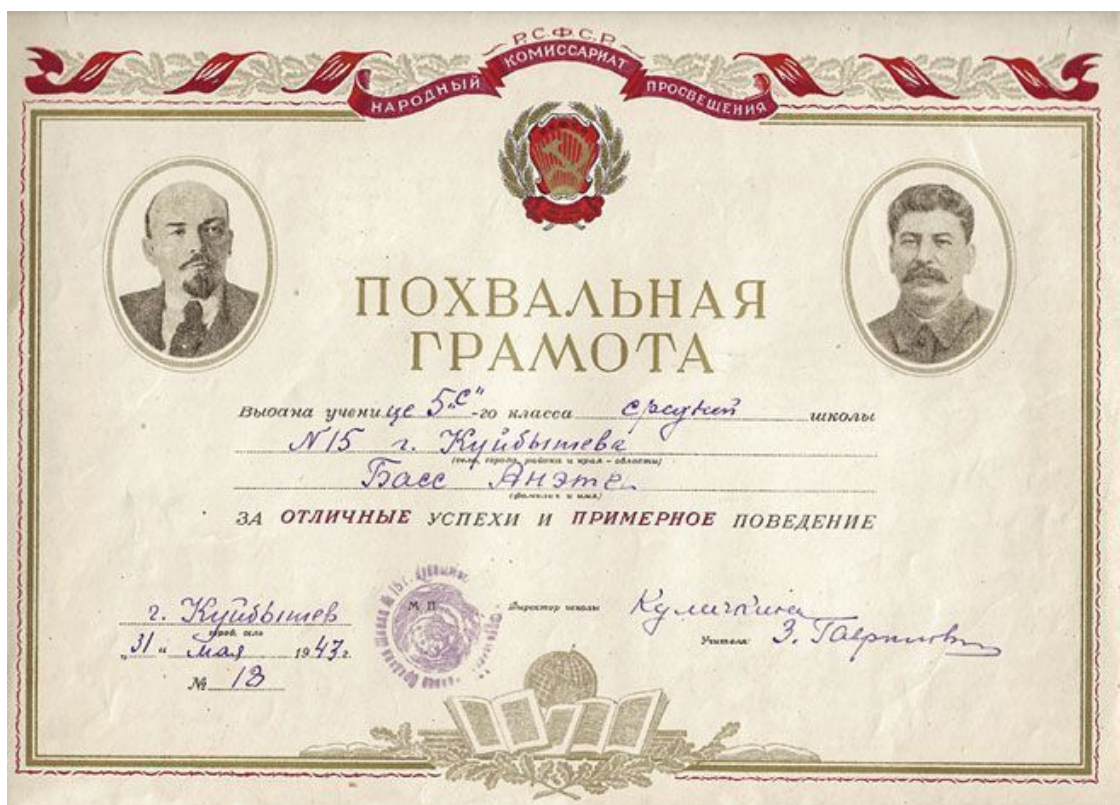
Похвальная грамота за 5-й класс. 1943