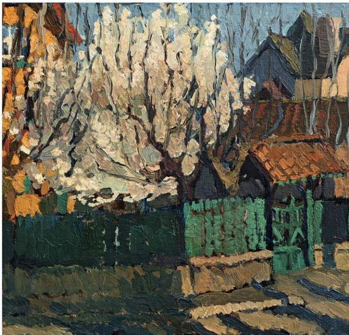
«Дом с зелёными воротами». Холст. Масло. Художник Екатерина Лямуан.