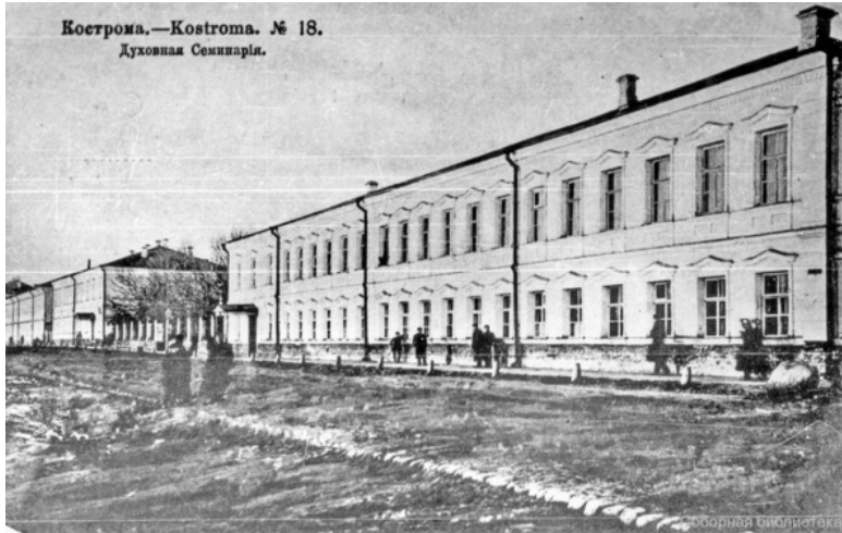
Кострома.—Kostroma. № 18. Духовная Семинарія.

Корпуса Костромской духовной семинарии на Верхней Набережной (современный адрес: Кострома, ул.1 Мая, д.14), открытка нач. XX века