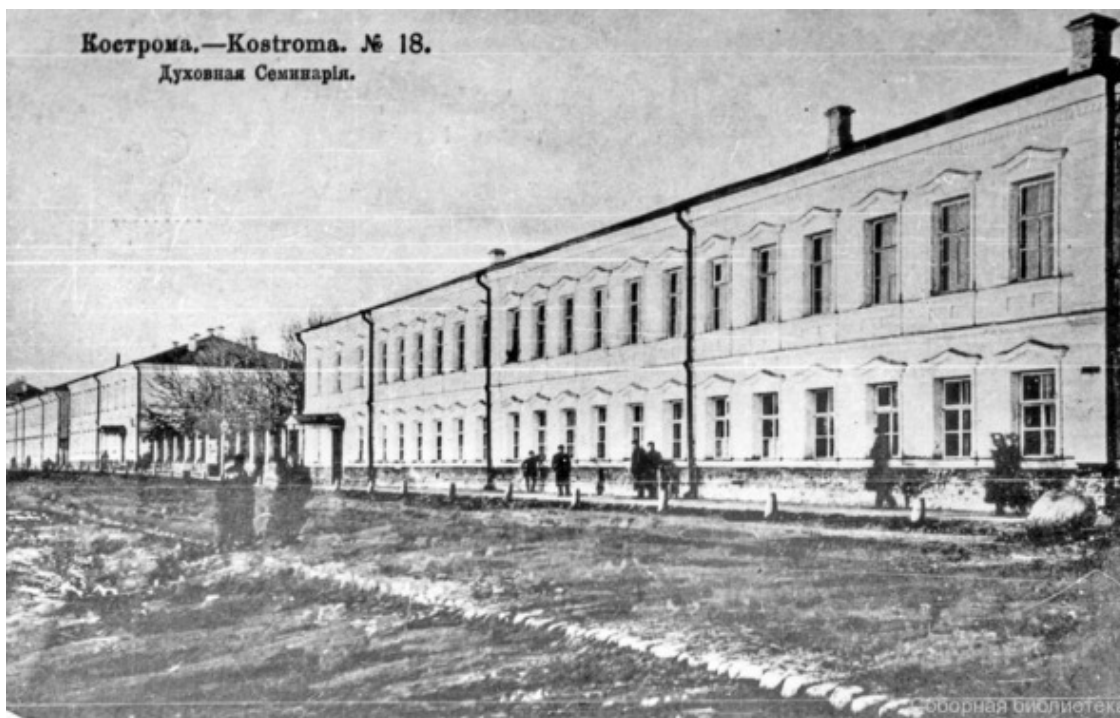
Корпуса Костромской духовной семинарии на Верхней Набережной (современный адрес: Кострома, ул.1 Мая, д.14), открытка нач. XX века