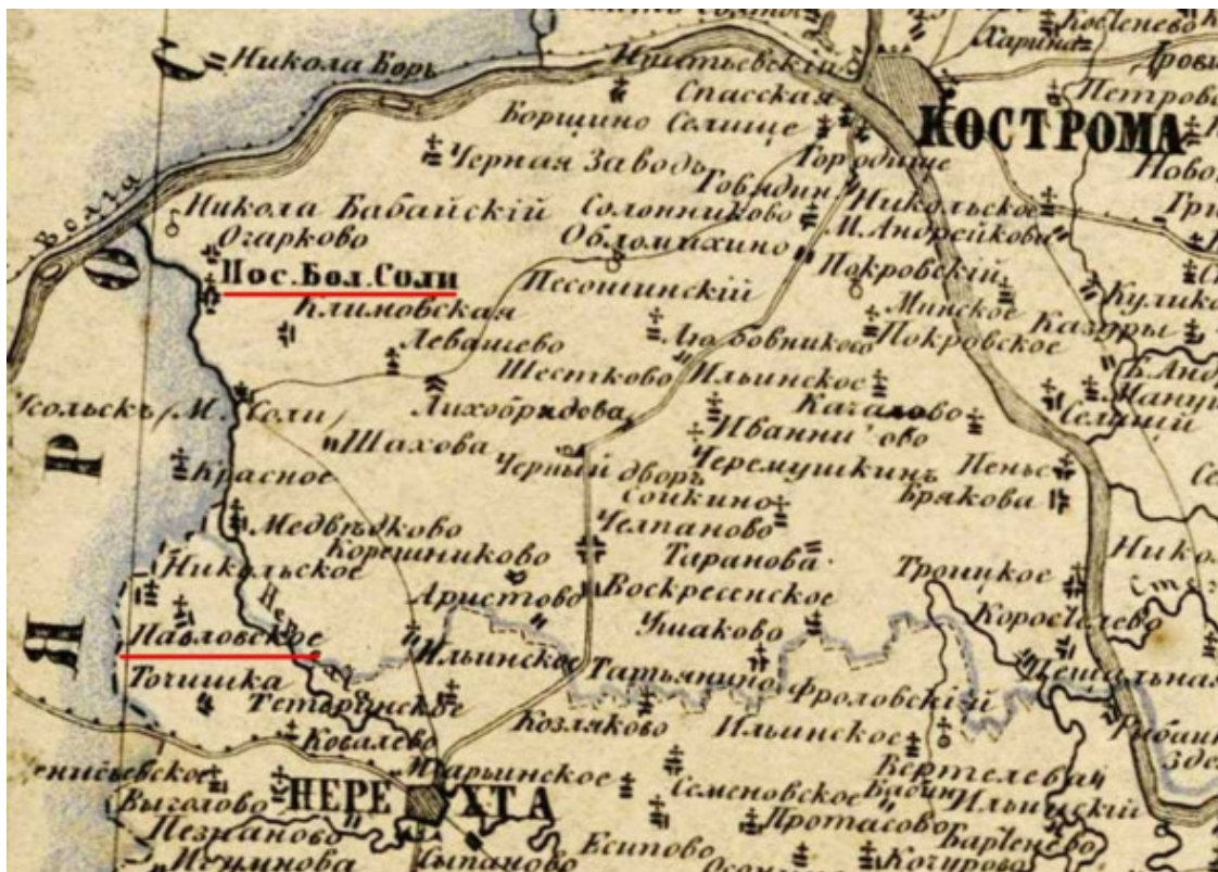
Фрагмент карты Костромской губернии конца XIX в., www.etomesto.ru