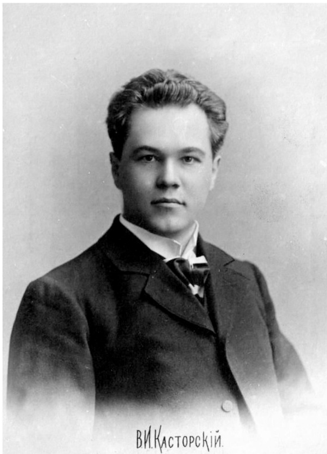
Владимир Иванович Касторский (2 марта 1870 г. ст., Большие Соли, Костромская губ. – 2 июля 1948 г., Ленинград) – российский и советский оперный артист (бас), камерный певец, вокальный педагог. Заслуженный артист и деятель искусств РСФСР. С 1898 г. солист Мариинского, затем Ленинградского театра оперы и балета. Участник Русских сезонов Сергея Дягилева. Wikipedia