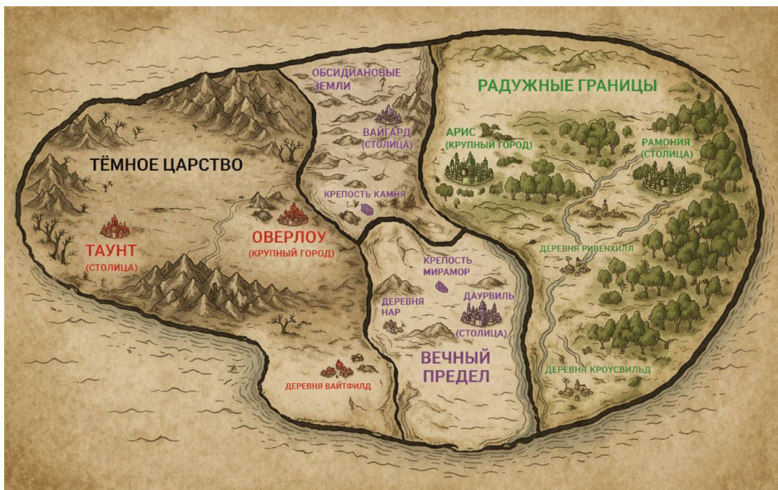
Карта мира с ключевыми местностями, которые описаны в книге.

Спасибо за вашу поддержку и интерес к моей работе.