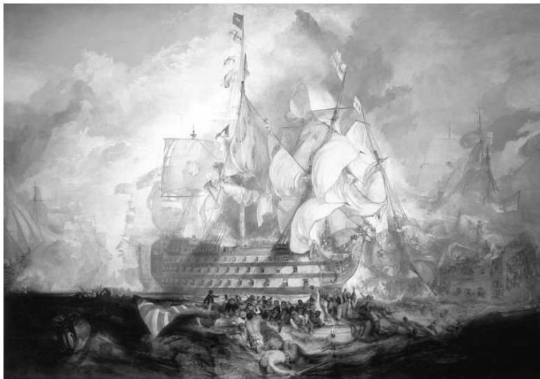
Трафальгарское сражение. Художник Дж. Тёрнер. 1822 г.

ралу Пьеру-Шарлю Вильнёву. До революции он был капитаном корабля, но в начале революции был репрессирован и вернулся на службу в 1795 году. В сражении при Абукире в 1798 году Вильнёв проявил пассивность, хотя и заменил погибшего вице-адмирала графа Франсуа-Поль Брюе д'Эгалье и с остатками флота сдался на Мальте англичанам. Таким образом, опыта успешного командования эскадрой у него не было.