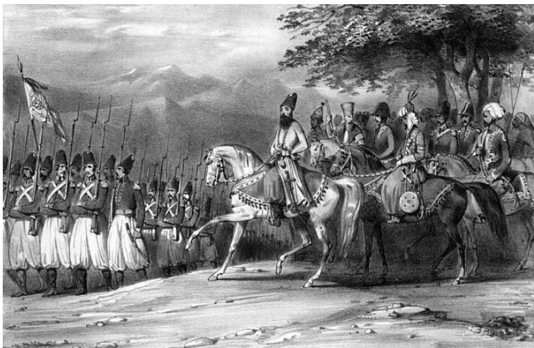
Аббас Мирза в сражении. Гравюра XIX в.

Пользуясь отвлечением основных сил русской армии на войну с Наполеоном, Аббас-мирза в августе 1812 года взял Ленкорань и Аркиван, что открывало дороги на Ширван и Баку. 10 (22) октября 1812 года персидский главнокомандующий наследник престола Аббас-мирза со своей армией подошёл к реке Аракс близ брода у Асландуза. Персидская пехота была им размещена на левом берегу Дарав-Юрд. На правом берегу Аракса, на возвышенности, расположилась кавалерия. Персы не выслали конные разъезды за Аракс, и нападение русских стало для них полной неожиданностью. Вплоть до лета 1812 года Персии оказывала помощь Англия,