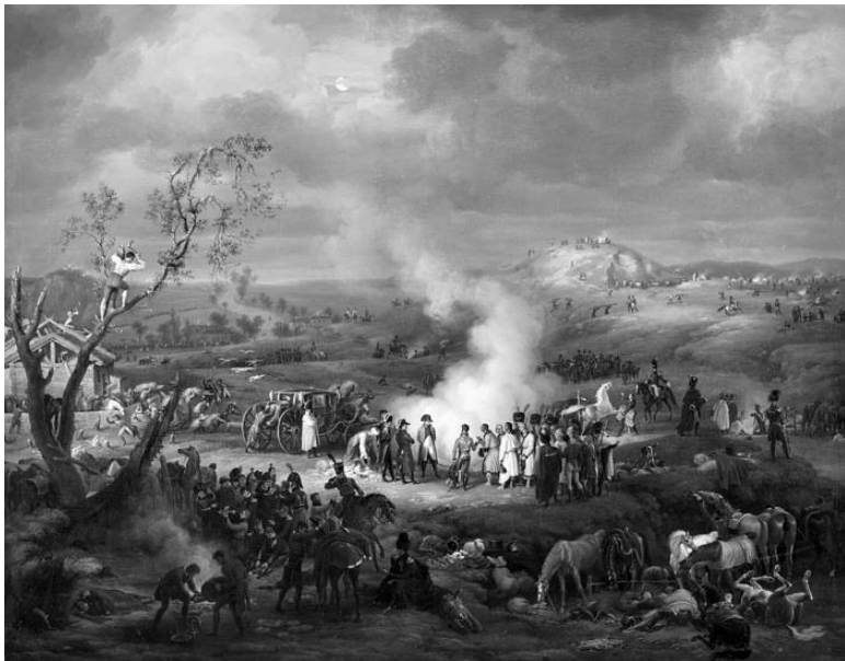
Битва при Аустерлице. Художник Л-Ф. Лежен. 1808 г.

Наполеон разгадал план союзного командования, считая, что оно будет стремиться отрезать французов от дороги к Вене и от Дуная, чтобы окружить их или загнать к северу, в горы, и для этого предпримет широкое обходное движение левым крылом. Сам же он вечером 30 ноября принял решение главные силы сосредоточить в центре, против Праценских высот, чтобы разгромить ослабленную центральную ко-