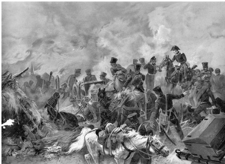
Эпизод битвы при Шёнграбене. Акварель Н.Н. Каразина. 1893 г.

бовавшего разорвать перемирие. Багратион отправил к Кутузову посланника с французским предложением о заключении перемирия, в ходе которого предполагалось русским отойти в Чехию, а наполеоновские войска обязались не входить в Моравию. Мюрат подписал это предложение и ожидал, что Кутузов сделает то же самое. Но Кутузов приказал Багратиону держаться, а сам перевел армию на другую дорогу.