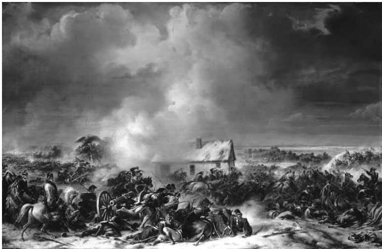
Эпизод битвы при Прейсиш-Эйлау. Художник Ж. Ланглуа. До 1849 г.

Более многочисленные русские батареи обстреливали французов, но их боевые порядки были прикрыты домами Эйлау и Ротенена. Французские же батареи поражали русских на открытом пространстве, а французские канониры были лучше подготовлены и стреляли чаще и точнее. Две дивизии корпуса Ожеро под командованием генералов Дежардена и Эдле атаковали русский центр через заснеженную равнину, обстреливаемые русской артиллерией. Тут внезапно налетела сильная снежная буря, и атакующие французы потеряли ориентацию и оказались менее чем в 300 шагах