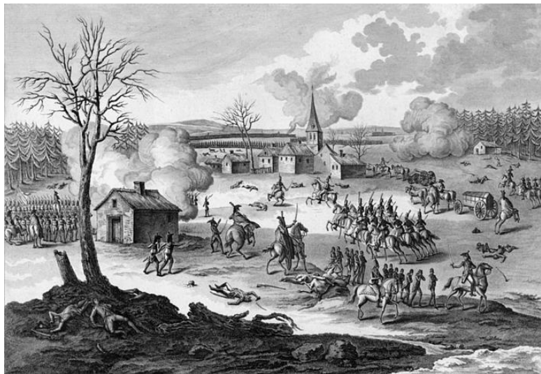
Битва при Гогенлиндене. Гравюра начала XIX в.

ши (1766–1847) должны были сдерживать австрийские войска на выходе из Хаагского леса, тогда как расположенные южнее дивизии дивизионного генерала Антуана Ришпанса и бригадного генерала Шарля Декана должны были ударить неприятелю во фланг, после чего должна была последовать общая атака всей французской армии.