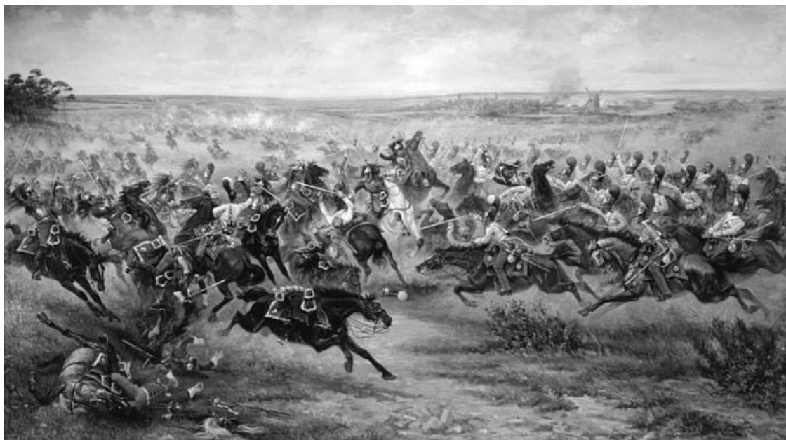
Атака русской лейб-гвардии в битве под Фридландом. Художник В. Мазуровский. 1912 г.

нанесла удар во фланг и тыл русского центра, а затем атаковала только что введенные в бой полки русской гвардии.