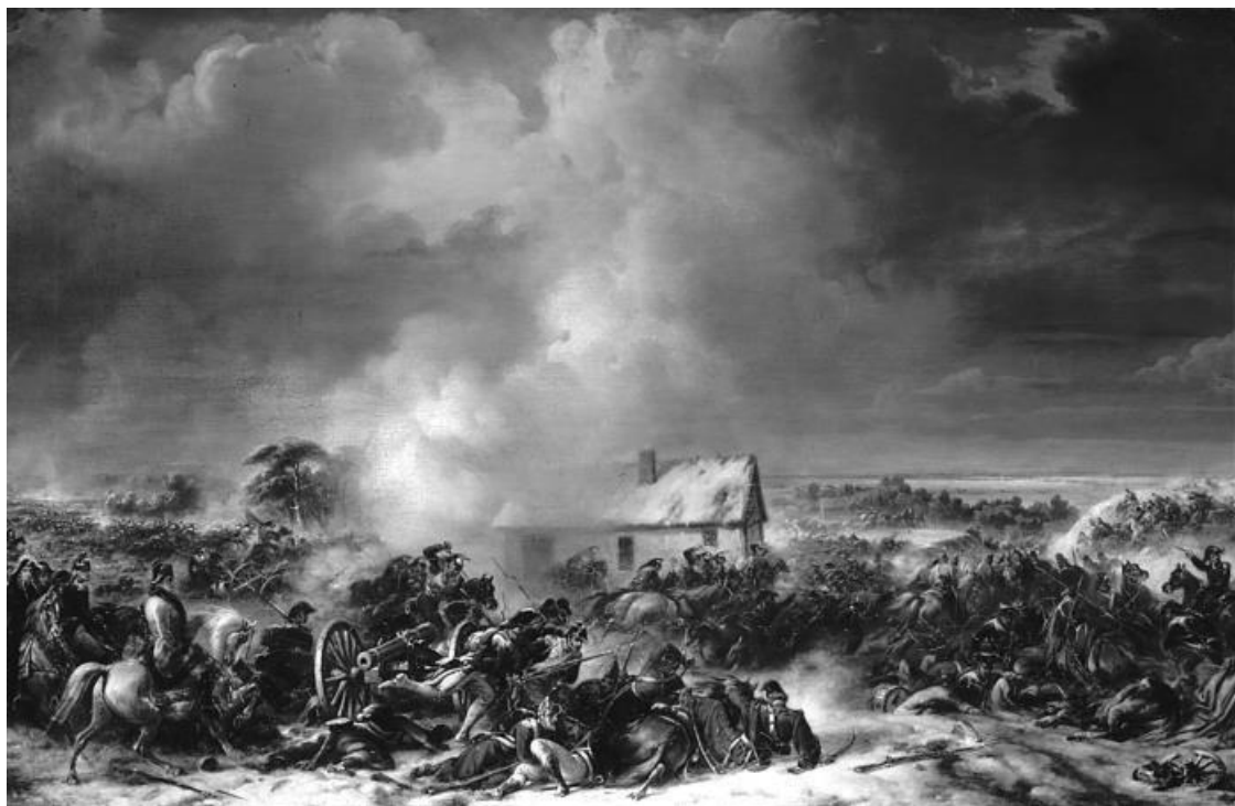
Эпизод битвы при Прейсиш-Эйлау. Художник Ж. Ланглуа. До 1849 г.

Шлодиттена был прикрыт бригадой лёгкой кавалерии Латур-Мобура. Наполеон находился с гвардией на кладбище Эйлау. Резервная кавалерия Мюрата находилась за корпусом Ожеро.