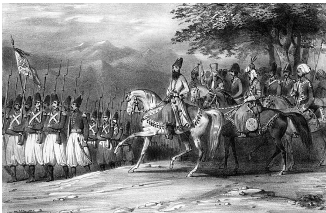
Аббас Мирза в сражении. Гравюра XIX в.

Битва при Асландузе является крупнейшим сражением Русско-персидской войны 1804–1813 годов. Отряд генерал-майора Петра Степановича Котляревского насчитывал 2221 человека, включая 511 донских казаков, и 5 орудий. Численность персидской армии точно не известна. По русским донесениям, персов было до 30 тыс. человек, но эти данные явно преувеличены. Лейтенант Уильям Монгейт, британский офицер, находившийся при армии наследного принца Аббаса-мирзы, сообщал, что, по оценке самого главнокомандующего накануне битвы, его армия превышала русский отряд в пять раз. В таком случае численность персидской армии можно оценить в 11 000 человек. У персов преобладала пехота, так как значительная часть кавалерии была отправлена в северные азербайджанские провинции.